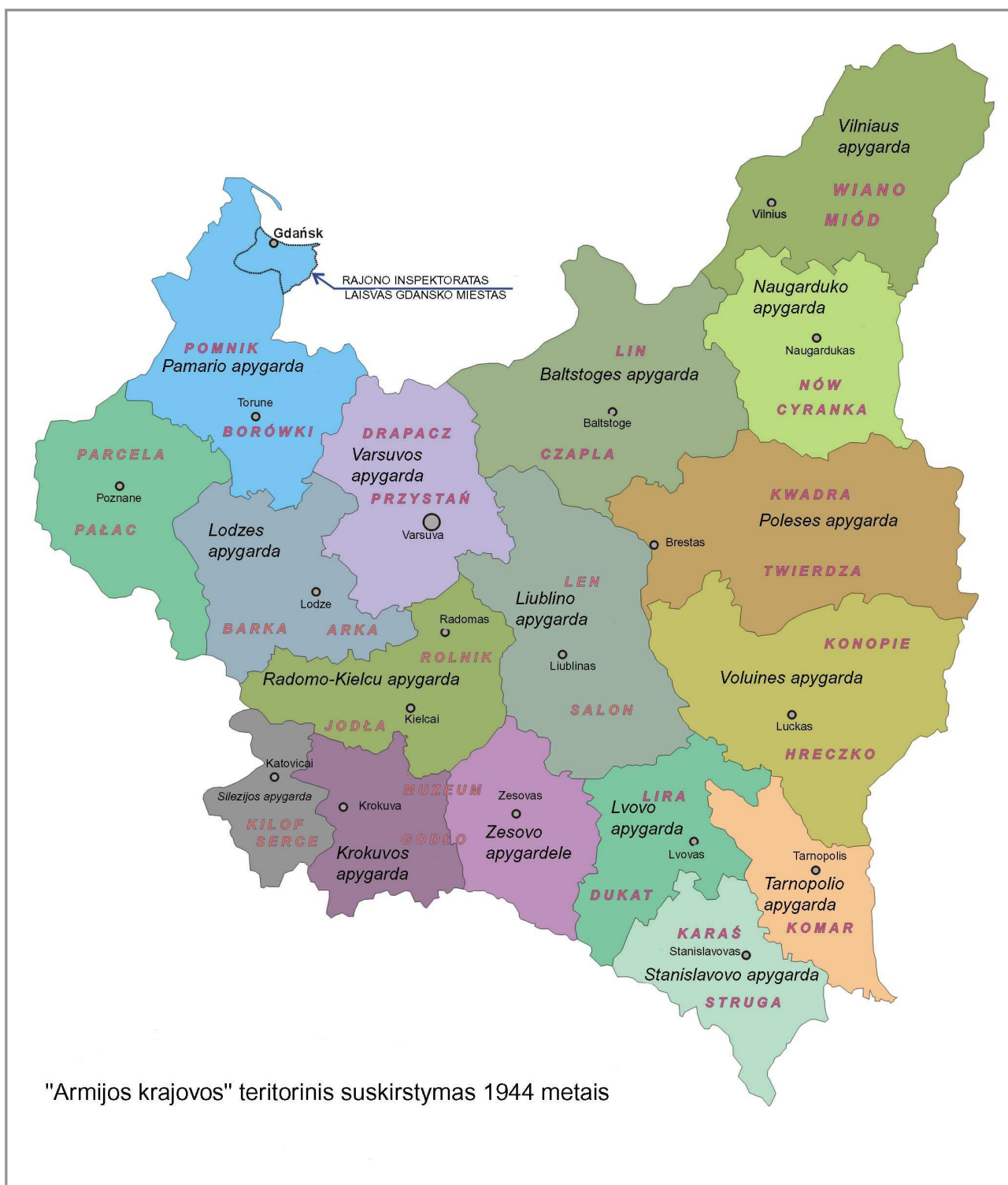
"Armijos krajos" teritorinis suskirstymas 1944 metais