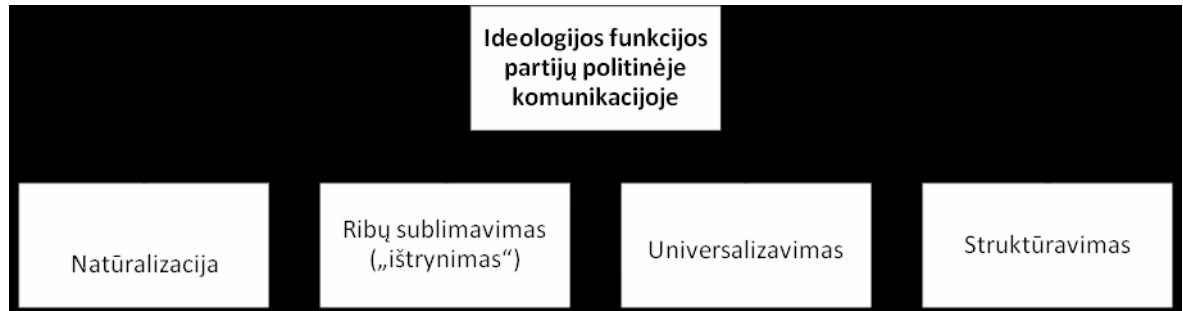
2 paveikslas. Ideologijos funkcijos partijų politinėje komunikacijoje.

Natūralizacinė ideologijos funkcija susijusi su tam tikrų politinių įsitikinimų laipsnišku pavertimu „savai suprantama tiesa“. Natūralizacinės ideologijos funkcijos pavyzdžiu galėtų būti laikomas Rytų ir Vidurio Europos politinė realybė pereinamuoju laikotarpiu po Tarybų Sąjungos žlugimo: kartu su Tarybų Sąjungos žlugimu Vidurio ir Rytų Europoje kilęs nacionalinių partijų radikalus nepasitenkinimas valstybės dalyvavimu ekonomikoje ir itin aukštas pasitikėjimas laisvosios rinkos galimybėmis užtikrinti ūkio gyvybingumą bei sąžiningą gėrybių paskirstymą (radikaliam komunizmui priešinga pozicija). Kalbant apie radikliosios dešinės ideologijos įsitvirtinimą ir radiklios retorikos virsmą natūralia politinio spektro dalimi, daugelis autorių pabrėžia, kad ši retorika Europoje tapo „savai suprantama“ ar bent toleruotina 2002-2003 m. laikotarpiu, pradedant radiklios dešinės įsitvirtinimu Nyderlandų partinėje sistemoje (BRUG, MUGHAN; p 29-51).