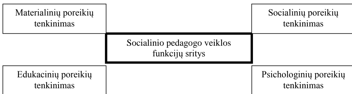
3 pav. Socialinių pedagogų veiklos funkcijų sritys

Socialiniam pedagogui svarbu išklausti vaiko problemas, stengtis palaikyti ugdytinį ar jo globėjus, siekti būti tarpininku tarp vaiko ir kitų specialistų bei padėti spręsti iškilusias problemas. Jei specialistams vieniems nepavyksta susidoroti su iškilusiais sunkumais, tada jie siekia numatyti kitus specialistus (institucijas), kurie galėtų prisidėti sprendžiant ugdytinių problemas. Socialiniai pedagogai padeda vaikams ir paaugliams adaptuotis visuomenėje, bendruomenėje bei švietimo ar globos įstaigose panaudojant visas priimtinas ugdymo formas, bendradarbiaujant su pedagogais, tėvais ir kitomis institucijomis, kurios siekia vaikų ir paauglių saugumo, teisių ir pareigų užtikrinimo bei fiziologinių poreikių tenkinimo. Jie prisideda prie ugdymo proceso, siekdami suprasti, kokia yra ugdytinio psichologinė ir socialinė būklė, kokią įtaką ugdymo procesui turi šeima, bendruomenė bei kultūra. (Kvieskienė, 2002).