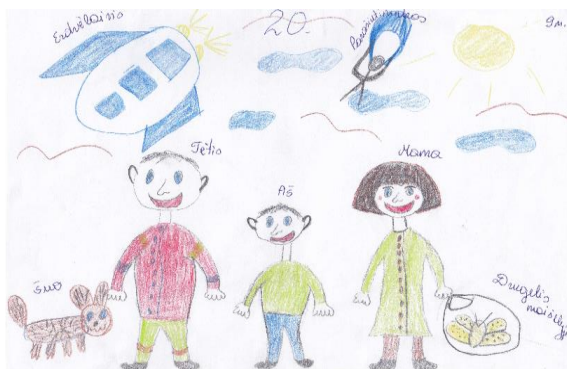
1 pav. „Šeimos“ piešinys

Remiantis vaiko mokytojos interviu, paaiškėjo, kad berniuko šeima susideda iš mamos, tėčio, jaunesnės sesers (5 mėnesių) ir jo paties. Tiriamojo šeima labai darni ir draugiška, gerai sutaria. Gimus mažajai sesutei, pablogėjo berniuko savijauta, jis pasidarė piktas, pavydi sesei didesnio tėvų dėmesio. Tarp draugų berniukas aktyvus ir impulsyvus, mėgsta būti dėmesio centre.