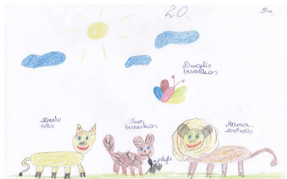
2 pav. „Gyvūnų šeimos“ piešinys