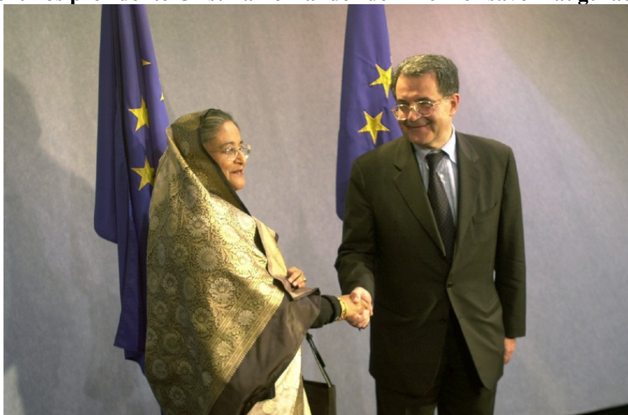
Bangladešo premjerë Sheikh Hasina Wajed.