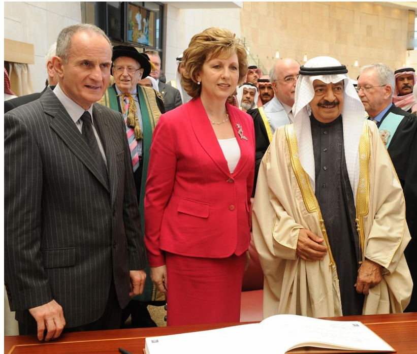
Airijos prezidentė Mary McAleese.