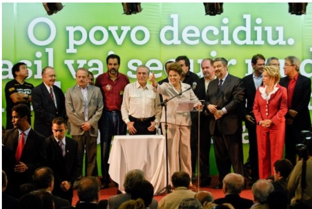
Nuotraukos centre – Brazilijos prezidentė Dilma Rousseff.