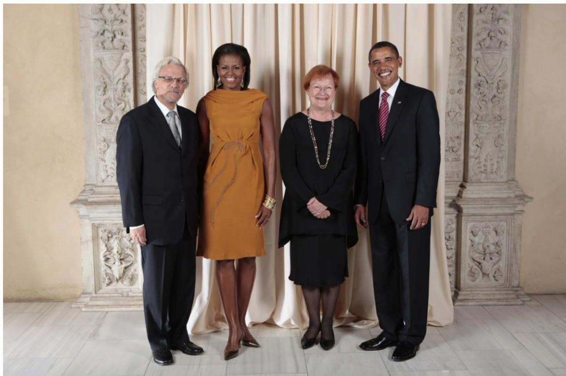
Suomijos prezidentė Tarja Halonnen su sutuoktiniu, Jungtinių Amerikos Valstijų prezidentu ir jo žmona.