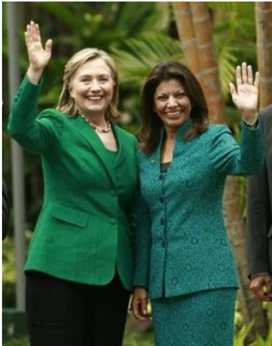
Jungtinių Amerikos valstijų sekretorė Hillary Clinton ir Kosta Rikos prezidentė Laura Chinchilla.