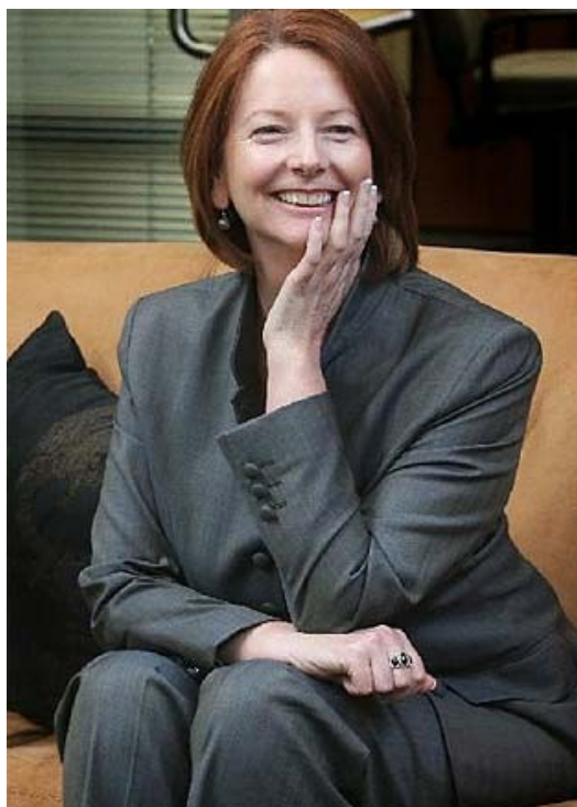
Australijos ministrė pirmininkė Julia Gillard.