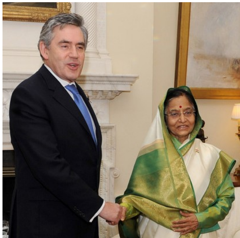
Indijos prezidentė Pratibha Patil su premjery Gordonu Brownu valstybinio vizito Didžiojoje Britanijoje metu.