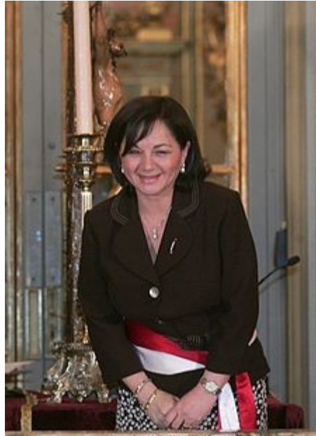
Peru ministrė pirmininkė Rosario Fernández.