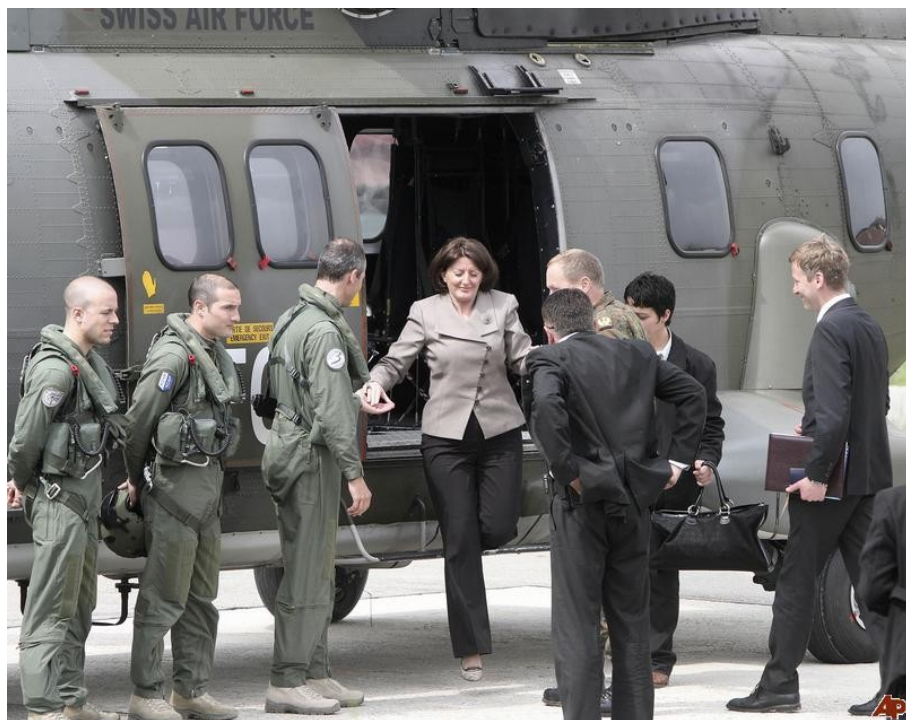
Kosovo prezidentė Atifete Jahjaga.