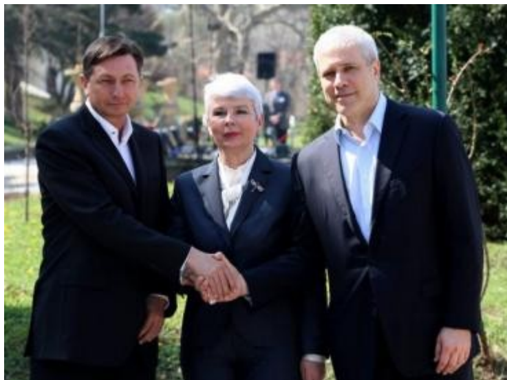
Kosovo premjerė Jadranka Kosor.