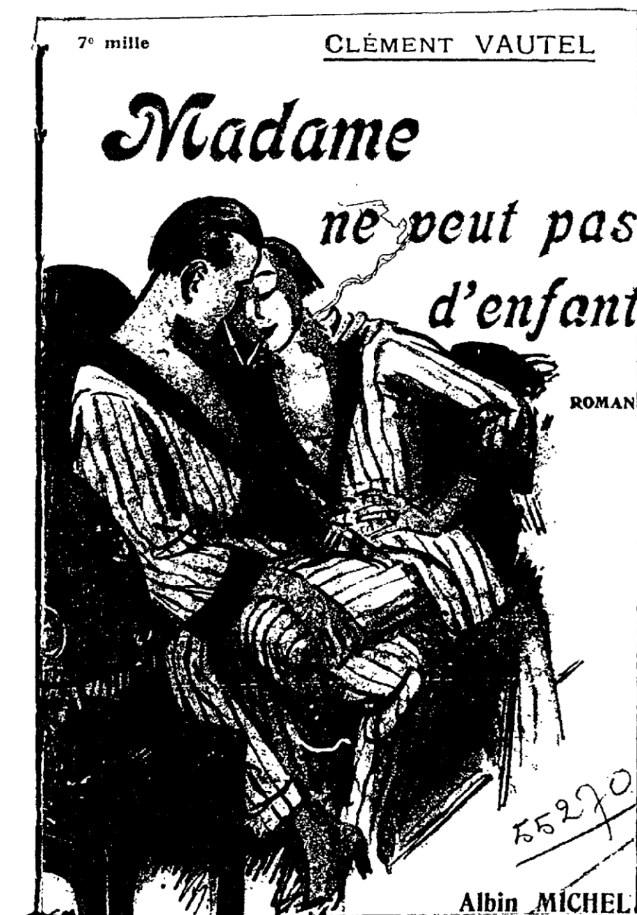
Figure 18. Clément Vautel, Madame ne veut pas d'enfant , 1924