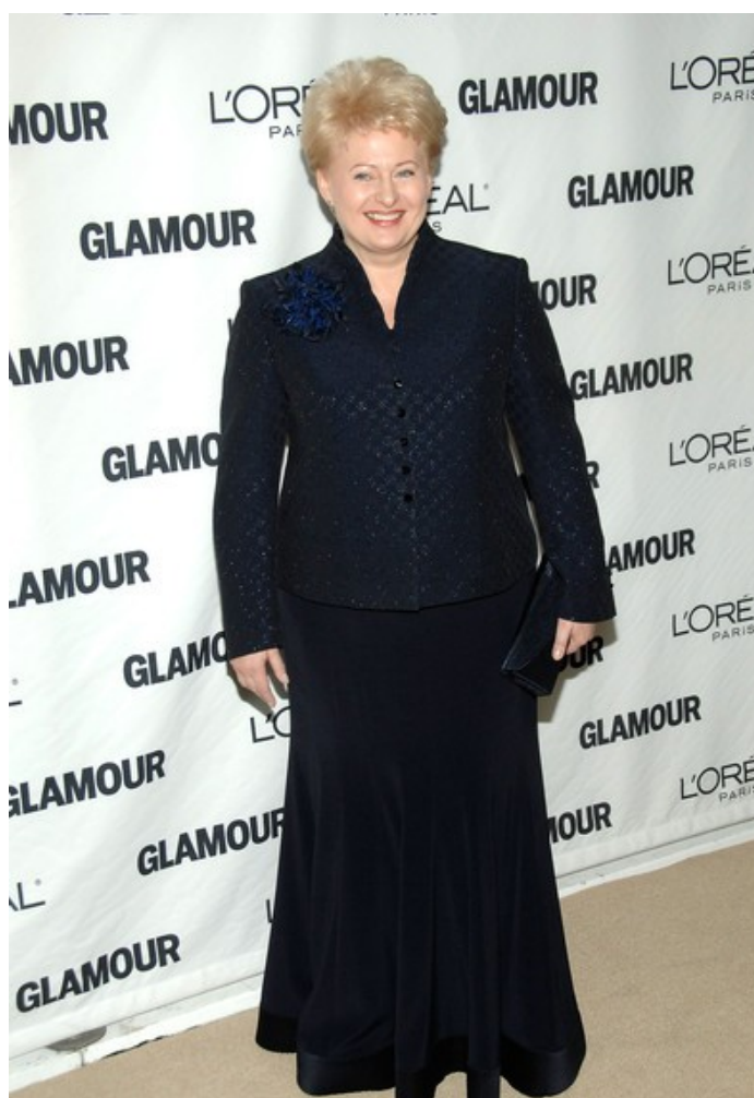
Lietuvos prezidentė Dalia Grybauskaitė žurnalo „Glamour“ apdovanojimuose.