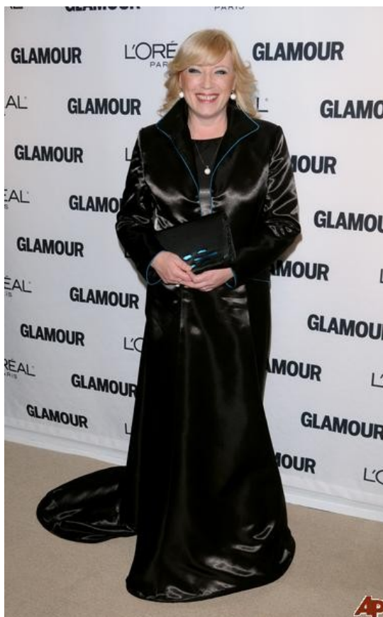
Slovakijos ministrė pirminikė Iveta Radicová žurnalo „Glamour“ apdovanojimuose.