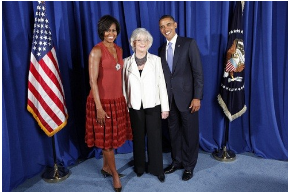
Islandijos ministrė pirmininkė Johanna Sigurdadottir su Jungtinių Amerikos Valstijų prezidentu ir jo sutuoktine. Priėmimas Junstinių tautų suvažiavimo metu.