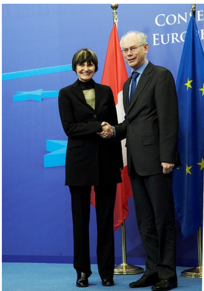
Šveicarijos prezidentė Micheline Calmy-Rey su Europos Sąjungos prezidentu Hermanu Van Rompuy.