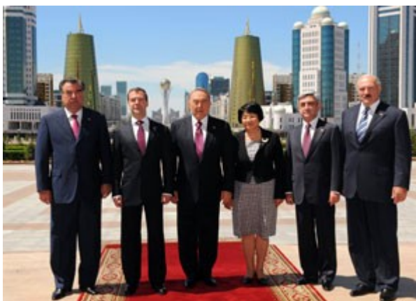
Tarptautiniame susitikime Kirgiztano prezidentė Rosa Otunbayeva.