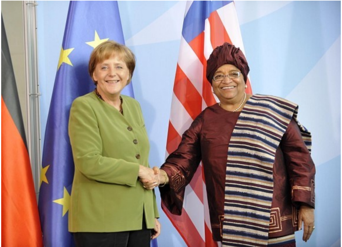
Vokietijos kanclerė Angela Merkel su Liberijos prezidentė Ellen Johnson-Sirleaf.