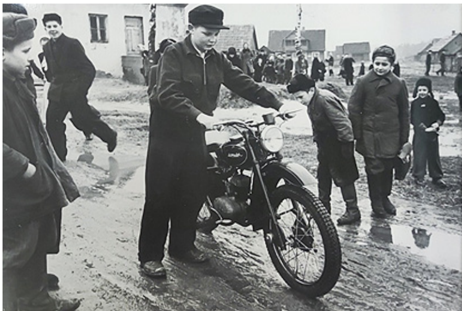
3 iliustracija. Kapčiamiesčio vidurinės mokyklos moksleivis apžiūrinėja prižą, mokyklai įteiktą už „gerą kovą su kolorado vabalu priemonių organizavimą“. (Karantino inspekcijos 1957 m. veiklos albumas, in: LCVA, f. R-356, ap. 1, b. 36, l. 62)

Apskritai pažvelgus į kolorado vabalo klausimą liečiančius aukščiausiu lygmeniu priimtus nutarimus ir įsakymus, atsakingų institucijų veiklos dokumentus, akivaizdu, jog kovoje su kenkėju buvo svarbus ne tik pats vaikų į(si)traukimas, bet ir jo išryškėjimas. Plačiai su bendru priešu kartu kovojančios, susitelkusios visuomenės regimybei sudaryti reikėjo amunicijos – jei mokyklose ir pionierių stovyklose instruktažus gavę vaikai kovai buvo apginkluoti žibalo buteliukais, tai suaugusiesiems (kartais ir vaikams) įpiršti metodai bei priemonės turėjo kur kas rimtesnių padarinių, kuriuos pajautė ne vien taikinyje atsідūrę kenkėjai.