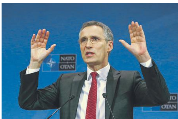
2 paveikslas. NATO generalinis sekretorius Rusijos šaltiniuose vaizduojamas kaip silpnas, pasiduodantis, kadangi inicijuoja NATO - Rusijos dialogą

Diskurse formuojama idėja, jog dialogas tarp Rusijos ir NATO reikalingas ne pačiai Rusijai, o Aljansui, kuris jį inicijuoja, prašydamas bendradarbiauti. Remiantis Rusijos užsienio reikalų ministerijos atstovų nuomone, kadangi dialogo su Rusija iniciatoriai – NATO, Aljansas mato būtinybę atnaujinti politinį dialogą su Rusija, kaip paskelbė NATO generalinio sekretoriaus Jens Stoltenberg. 83 Visgi iš Rusijos pusės pabrėžiama, jog sugrįžimas prieš įprastinių santykių negalimas, kol Aljansas sieks kontroliuoti Rusiją, kol puoselės mitą, jog grėsmė kyla iš Rusijos. 84 Diskurse