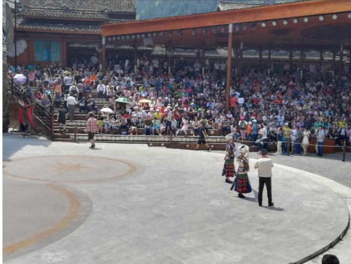
5 pav. Šokių ir dainų pasirodymų erdvė