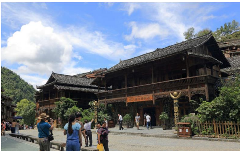
6 pav. Muziejus: baidu.com