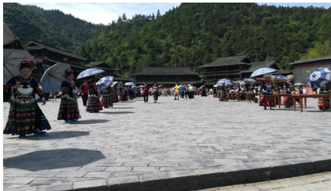
1 pav. Turistų sutikimo erdvė

Nuo pagrindinės stovėjimo aikštelės palypėjus laiptais, turistai patenka į erdvią aikštę, kurioje jį pasitinka eilėmis sustojusios moterys arba merginos, vilkinčios Miao nacionalinius kostiumus. Fone, didžiuliam ekrane, rašomi pasveikinimai atvykus ir kviečiama įžengti į Miao kultūrinį pasaulį, pavyzdžiui, „Mėgaukis kitoniškos vietovės kaimišku kraštovaizdžiu ir ūkininkavimo kultūra“, „Miao kaimas – absoliučiai originalios ekologiškos kultūros vieta“ 6 . Ekrane rodomi šokantys, dainuojantys vietiniai gyventojai, akcentuojama batika ir jų gaminami sidabro dirbiniai. Taigi, netgi prieš įžengiant į turistinę teritoriją, stebėtojai pateikiami suobjektinti vietinių gyventojų kūnai tiek fizine, tiek skaitmenine forma.