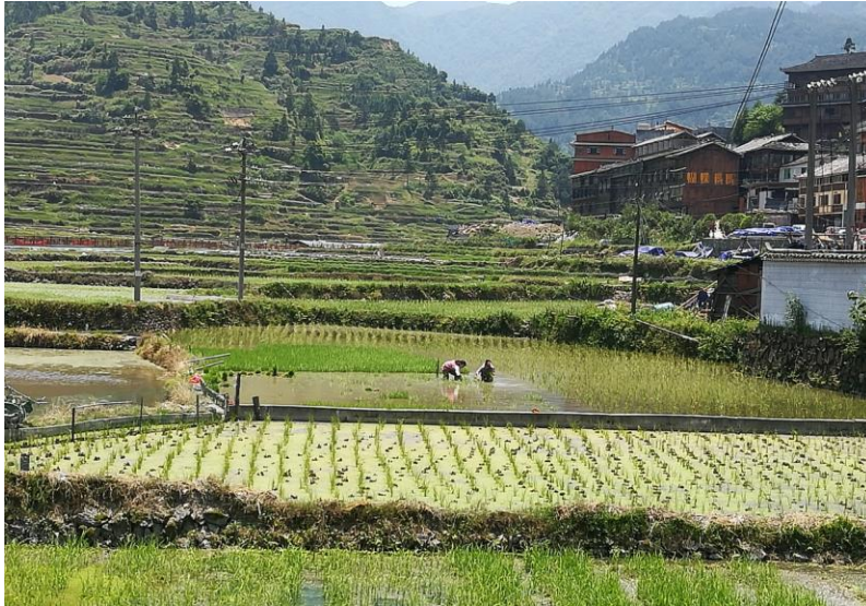
7 pav. Agrikultūriniai laukai