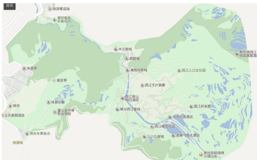
3 pav. Xijiang kaimo geografinė teritorija: baidu.com

Semiotinei analizei atlikti surinkta 461 žemėlapyje pavaizduoto objekto pavadinimas: aikščių, pastatų, lankytinų objektų, viešbučių, svečių namų, pasilinksminimo vietų (kavinių, barų, KTV). Iš visų pavadinimų oficialios įstaigos ir pastatai (pavyzdžiui, Leishan apskrities viešojo saugumo biuras Xijiang policijos stotis 雷山县公安局西江派出所, Leishan apskrities miškų biuras Xijiang miesto miškų stotis 雷山县林业局西江镇林业站) ir nedidelė dalis į turistus orientuotų objektų (pavyzdžiui, Xijiang kultūros ir meno centras 西江文化艺术中心, buivolo rago dirbtuvės 牛角工坊). Likusius pavadinimus galima suskirstyti į binarines matricas. Lentelėse pavaizduota tipiniai pavadinimų pavyzdžiai: