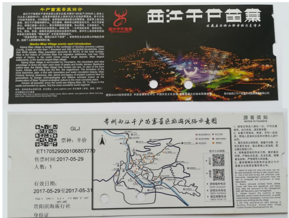
2 pav. Bilietas į Xijiang kaimą

taisyklėmis, nurodančiomis saugumo, higienos reikalavimus. Turistai visos viešnagės metu privalo su savimi turėti asmens, kelionės dokumentus, įėjimo ir transporto bilietus, kurie gali būti reikalingi pasimetimo atveju. Taigi kiekvienas turistas, dar prieš įžengiant į kaimo teritoriją, yra patikrinamas, užregistruojamas, o jo „teisėtumas“ viešėti Xijiang bet kurią akimirką gali būti patikrinamas.