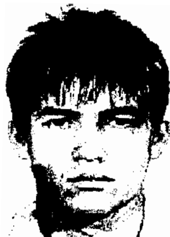
Pakeista antrojo etaloninio veido nosis