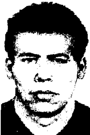
Pirmasis etaloninis veidas