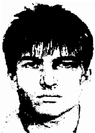
Antrasis etaloninis veidas