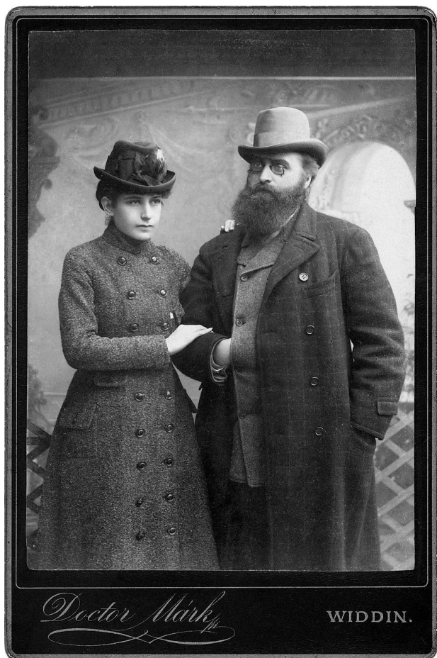
1 pav. Jonas Basanavičius su žmona Gabriele Eleonora Mol-Basanavičiene Bulgarijoje, apie 1885 m.