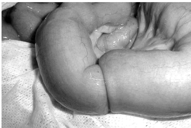
1 pav. Intraoperaciniai radiniai: jejunojejuninė invaginacija

Pranešimai apie tokias retas, tačiau kliniškai reikšmingas ligas kaip Peutso ir Jegherso sindromas yra svarbūs, kad liga būtų laiku diagnozuojama ir tinkamai gydoma.