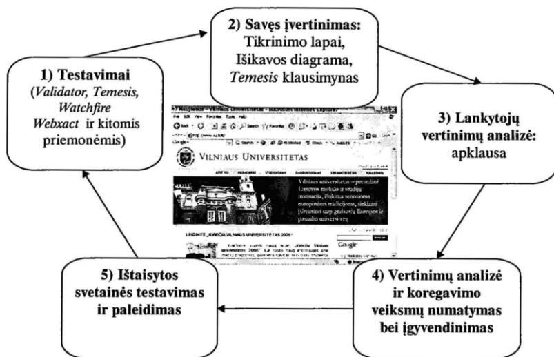
2 pav. Interneto svetainės kokybės vertinimo metodikos algoritmas

tainės kode jau yra įrašyti „meta-tags“ ir pagrindiniai žodžiai, tinkamai aprašyti grafiniai elementai, atsirado galimybė keisti šrifto dydį ir kt. Tačiau tai yra vienkartiniai kokybės gerinimo veiksmai. Svetainės techninei kokybei užtikrinti reikėtų vykdyti nuolatinę svetainės stebėseną.