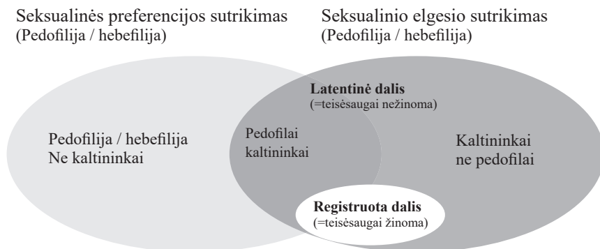
Schema. Seksualinės preferencijos ir seksualinio elgesio sutrikimų atskyrimas 30

Apibendrinant reikia pasakyti, kad psichikos ligų diagnostikoje pedofilija laikoma parafilija (nuo normos nukrypstančiu seksualiniu interesu), o kaip pedofilinis sutrikimas (liga) ji diagnozuojama tada, kai seksualinis interesas lytiškai nesubrendusiems vaikams yra ilgalaikis, kryptingas ir intensyvus, pasireiškiantis nesiliaujančiomis seksualinėmis mintimis, fantazijomis, potraukiais ar elgsena, sukeliantis kančią pačiam asmeniui arba aplinkiniams. Tik nedidelę seksualinės prievartos prieš vaikus atvejų dalį galima sieti su pedofilija (žr. schema ), o didžioji seksualinės prievartos, įskaitant ir padarytos dėl pedofilinio sutrikimo, atvejų dalis yra latentinė.