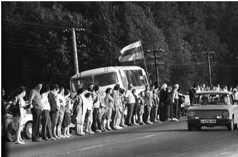
Šiaulių rajono sąjūdininkai dalyvauja akcijoje „Baltijos kelias.