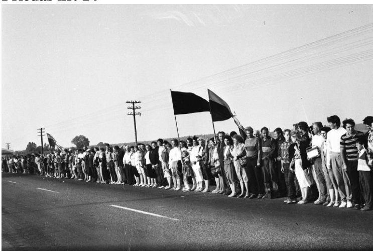
Šiaulių rajono sąjūdininkai dalyvauja akcijoje „Baltijos kelias.