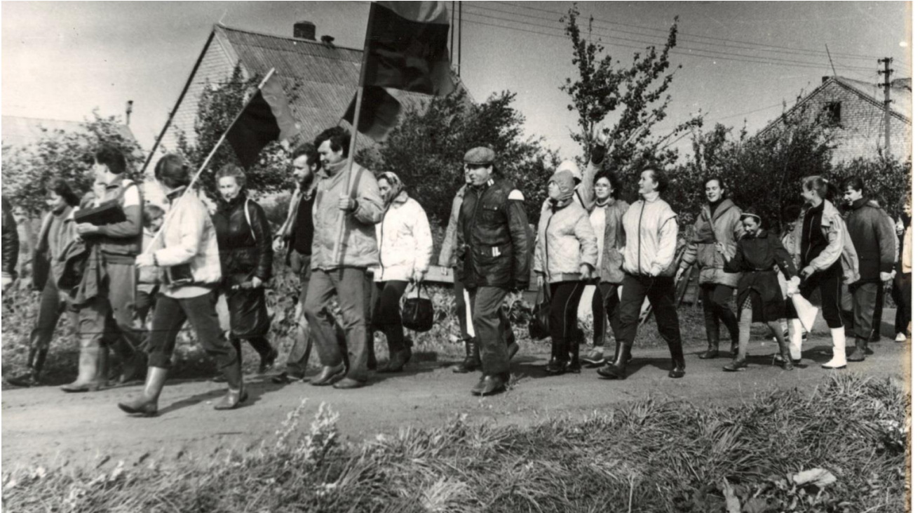
Ekologinis žygis Mūšos pakrantėmis.