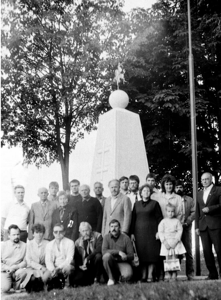
Vyčio paminklo Kuršėnuose atstatymo ceremonija.