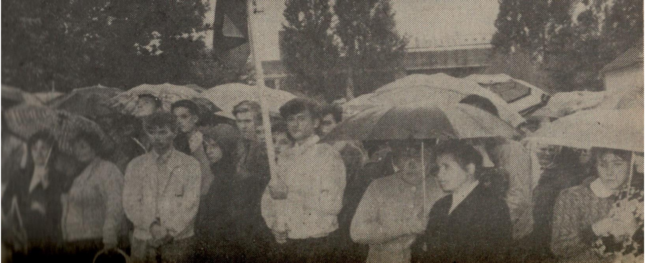
Pirmasis Sąjūdžio mitingas Pakruojuje. Nuotraukos autorius nežinomas