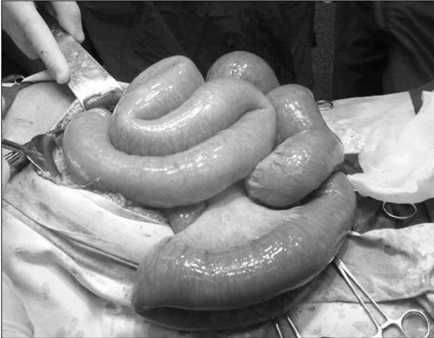
2 pav. Mechaninis plonosios žarnos nepraeinamumas