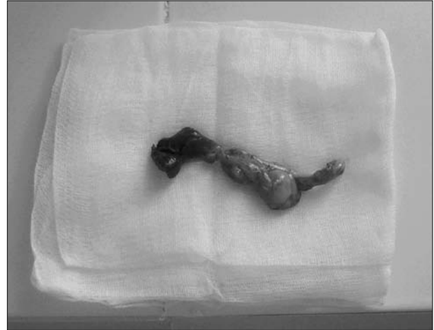
3 pav. Pašalinta kirmėlinė atauga, sukėlus mechaninį plonosios žarnos nepraeinamumą; joje antriniai pokyčiai