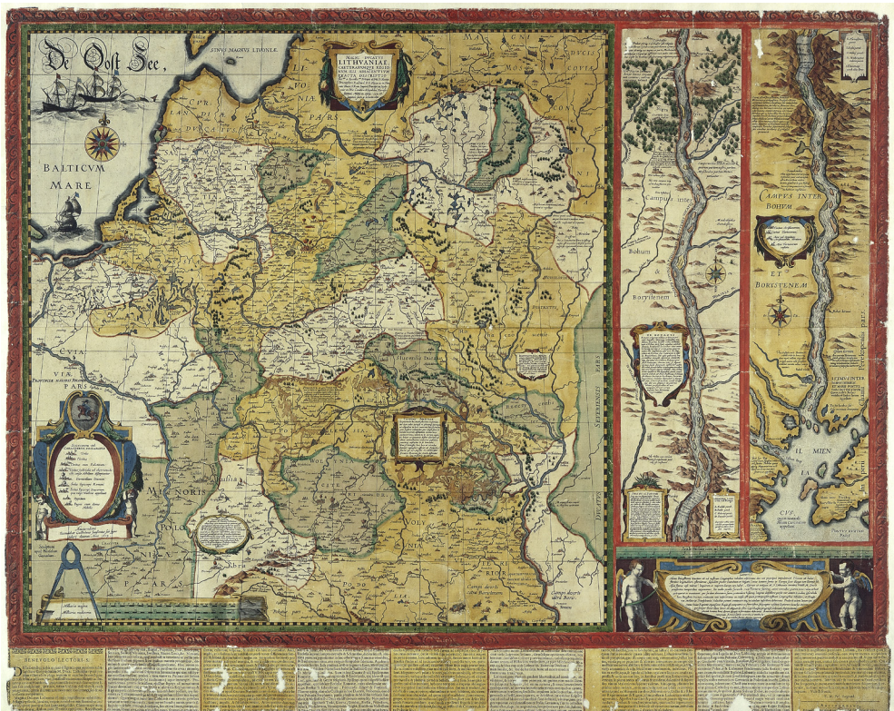
1 PAV. Sieninis LDK 1613 m. žemėlapis Veimaro kunigaikštienės Annos Amalijos bibliotekoje, atspausťas nuo keturių vario plokščių, su žemėlapio apačioje priklijuotu T. Makowskio tekstu