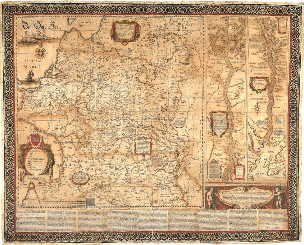
4 PAV. Upsalos universiteto bibliotekoje saugomas sieninis LDK 1613 m. žemėlapis, atspausstas nuo šešių vario plokščių, su T. Makowskio tekstu ir atskirai priklijuotu dekoratyviniu apvadu