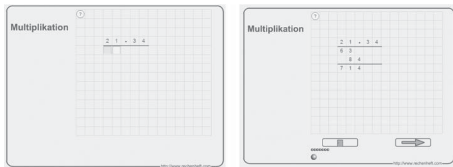
1 pav. Skaičių dauginimo būdas „Rechenheft“ programoje (Austrija).