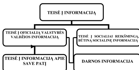
3 pav. Teisė į Darnos informaciją

būtinoms visuomenei ar atskiram žmogui socialinės informacijos bei oficialios valstybės viešojo administravimo institucijų informacijos modulius. Darnos informacijai patekus į viešojo administravimo sistemą, šios informacijos teikimo pareigą viešojo administravimo institucijoms, (o kartu ir netiesiogiai) visuomenei įgyja šią informaciją kuriantys subjektai. Darniojo vystymosi socialinės pažangos suvoktis lemia ir tiesioginio darnos informacijos teikimo visuomenei poreikį. Visuomenė suinteresuota žinoti informaciją, svarbią šios socialinio vystymosi krypties suvokčiai, palaikymui. Būtent siekiant užtikrinti visuomenės dalyvavimą vykstant darniajam visuomenės vystymuisi, teoriniu lygmeniu pagrindžiama ne tik visuomenės, visuomenės grupių ar pavienių asmenų teisė