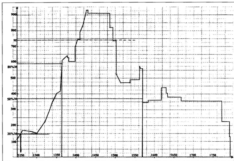
3 pav. Senosios Lietuvos valstybės ploto kaita 1250–1795 m.

rado Latgalą, kartu nebeliko dėl jos, kaip bendros LDK ir Lenkijos valdos, statuso kylančių keblumų vertinant LDK plotą. Baltarusių istorikas nebenurodo LDK ploto po antrojo (1793 m.) padalijimo, bet jį pateikia K. Pakštas: 132 500 km 2 .