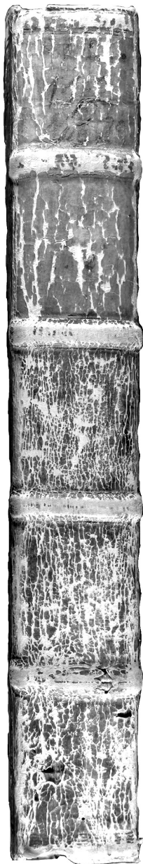
Postilės apatinis ketviršis ir nugarelė