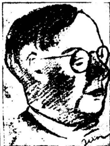
„Izviestiju“ atstovas rašytojas Vsevolodas Ivanovas.