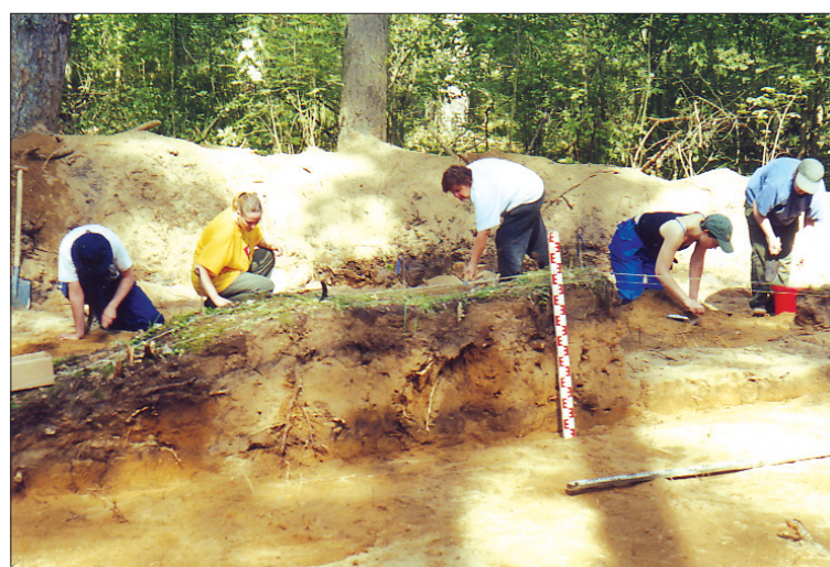
2, 3 pav. Jakšiškio pilkapyno archeologiniai kasinėjimai