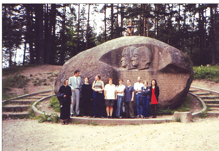
4 pav. Ekspedicijos dalyviai prie Puntuko akmens