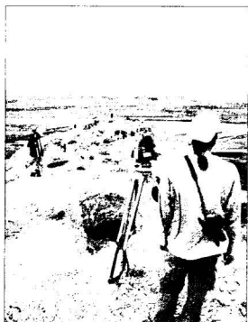
Matavimai nelegalių kasinėjimų sužalotame objekte Koške Bohar

Vėlesnių nei akmens amžiaus epochų archeologijos paminklai aptinkami ir lokalizuojami pagal natūralios erozijos bei nelegalių kasinėjimų metu į žemės paviršių iškeltą keramiką. Žvalgytųjų metu Goro provincijoje aptikti archeologijos paminklai yra palikti ankstyvųjų žemdirbių, priklauso Okso kultūriniam kompleksui, ir bronzos amžiaus (3300–2500 m. pr. Kr.) Helmando kultūrai. Hari Rudo (Arijaus) upė, žemupyje Turkmėnistane turinti Tedženo vardą, baigiasi ankstyvųjų žemdirbių Tedženo oaze. Ši upė, tarsi kultūrų tiltas, jungė dabartinio Turkmėnistano ankstyvosios žemdirbystės centrą su Indo upės žemdirbių civilizacijos regionu. Šių kultūrų paminklai paplitę derlinguose Hari Rudo slėniuose. Vienas ryškiausių tokių paminklų yra ekspedicijų metu aptikta Pumbakaro daugiasluoksnė gyvenvietė ir tapa kompleksas. Šios epochos keramikos, datuojamos IV–III tūkstm. pr. Kr., surasta ir Ahangarano apylinkėse 13 . Kur kas daugiau pavyko aptikti ankstyvojo