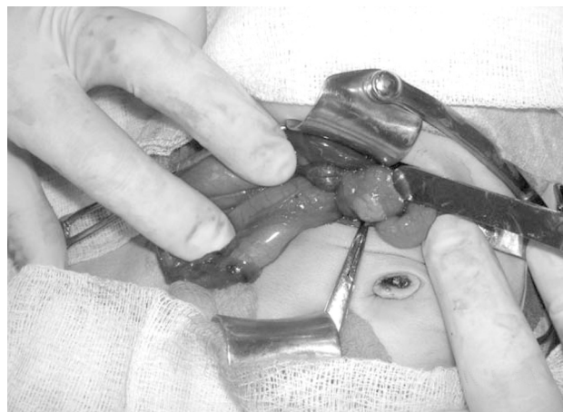
4 pav. Naujagimio operacijos nuotrauka

Metų ir 4 mėnesių mergaitė K.P. nuo 2 mėnesių ėmė vemti, neaugo svoris. Atlikta pilvo ertmės organų echoskopija, rastas išsiplėtęs skrandis, dvylikapirštė žarna, plonoji žarna subliūškusi. Blužnis dešinėje pilvo pusėje. FEGDS duomenys: stemplės gleivinė be uždegimo pokyčių, įskrandžio žiedas užsiveria. Skrandžio anatomiciniai endoskopiniai orientyrai pakitę: jis persikusęs, maisto likučiai prievartčio urvo dalyje, prievartčio žiedas žiojėja. Dvylikapirštės žarnos stormuo platus, jos gale žarnos spindis labai susiaurėjęs, yra maisto sancaupa. Atliktas kontrastinis virškinimo trakto tyrimas: plaučiai, širdis be rentgenologinių pakitimų, stemplė normalaus