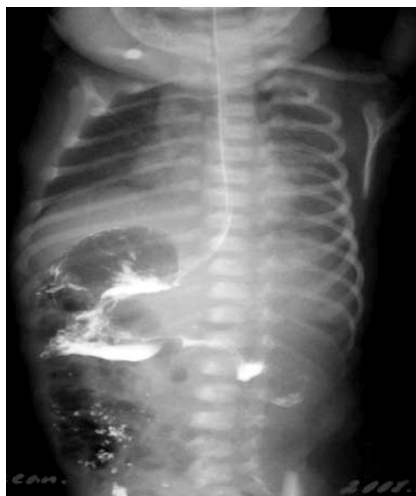
2 pav. Naujagimio kontrastinė virškinimo trakto rentgenograma

pilvo pusėje, o siaura, oro neprispildžiusi plonoji žarna – kairėje.