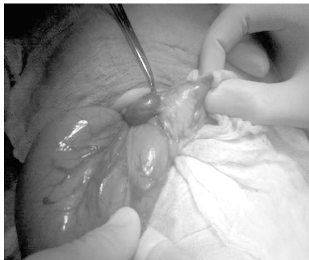
6 pav. Tos pačios mergaitės operacijos nuotrauka

zondas. Kadangi akloji žarna buvo aukštai pakrūtinyje, atlikta apendektomija. Pooperacinė eiga sklandi – mergaitė pradėta maitinti, nustojo vemti. Žaizdai sugijus, septintą pooperacinę parą išrašyta į namus.