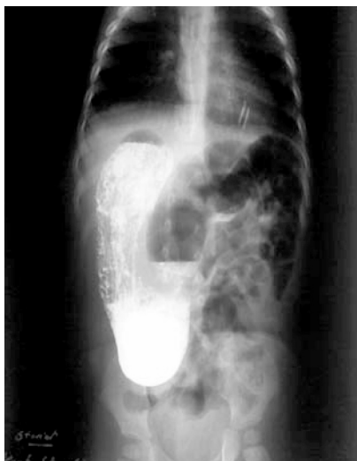
5 pav. 1 metų 4 mėnesių mergaitės kontrastinė virškinimo trakto rentgenograma