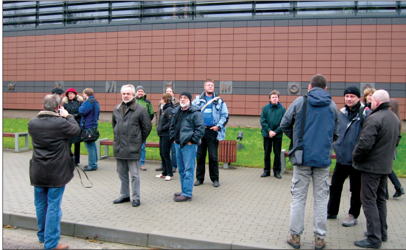
4 pav. Konferencijos dalyviai prie Kernavės archeologijos ir istorijos muziejaus