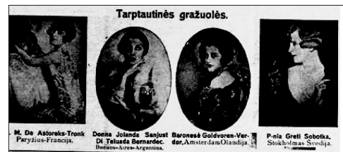
6 pav. Tarptautinių gražuolių fotografijos (NŽ 1926, 7)

macijos gausa buvo beveik nevaldoma, o spaudoje būdavo gana atvirai aptariamąs visos gyvenimo sritys. Tirtose medžiagoje dominuoja reklamos iš vakarietiško kino filmų, Holivudo gražuolių, kino aktorių nuotraukos (žr. 6 pav.), straipsniai, kuriuose gvildenami įvairūs moterų gyvenimo sričių klausimai. Nemažai Lietuvos moterų siekė lygiuotis į pasaulio madų tendencijas, nuolat aptarinėtas leidiniuose 21 . Daug dėmesio leidiniai skyrė Anglijai, Austrijai, Prancūzijai, Amerikai, Italijai. Mados tematika daugiausia analizuota Naujame žodyje 22 .