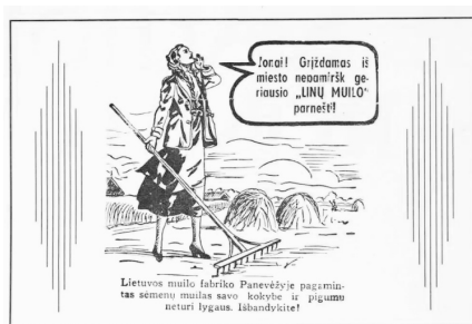
13 pav. „Linų muilo“ reklama (NR 1939, 47)

I Lietuvos Respublikos spaudoje galima atrasti ir tokį moters vaizdinį, kai derinamas modernumas ir tautiškumas (žr. 12, 13 pav.). Tai ne itin pasisekęs bandymas kurti savitą, moderniai nacionalinį moters vaizdinio variantą. Konservatyvioji visuomenės dalis tai vertino neigiamai. Toks moters įvaizdis reklamose nedažnas, tačiau buvo neretas ant leidinių viršelių ar tekstų iliustracijose.