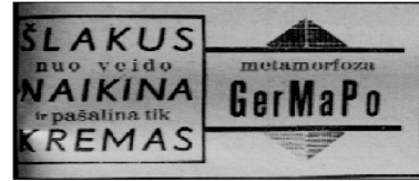
5 pav. Kremo reklama (M 1940, 11–12)