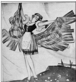
12 pav. Iliustracija (NŽ 1930, 8)