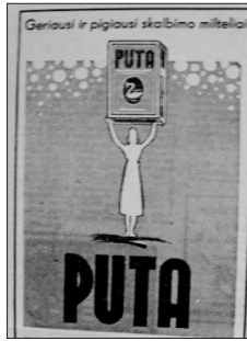
2 pav. Skalavimo miltelių reklama (M 1940, 9–10)