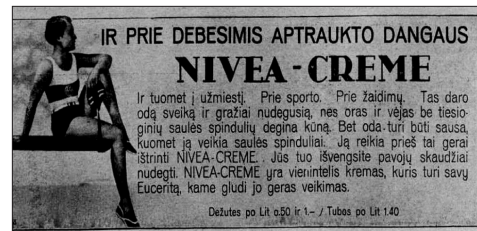
7 pav. Kremų „Nivea“ reklama (NŽ 1930, 14)

Vakarietiško tipo moters vaizdinio pagrindas – kūno kultas (plg. Daugirdaitė 2000b). Naujame žodyje paskelbti labiausiai patinkančios kino žvaigždės konkurso