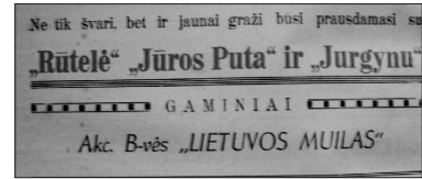
4 pav. Muilo reklama (M 1940, 11–12)