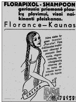
8 pav. Muilo „Florence“ reklama (NR 1937, 20)