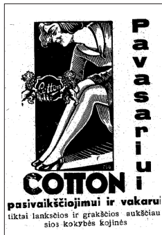
9 pav. Moteriškų kojinių „Cotton“ reklama (NR 1937, 20)