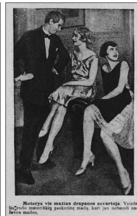
11 pav. Modernaus stiliaus moterys (NŽ 1926, 7)

Su kūno kultu susijusi ir madingos moters samprata. Lietuvos viduriniojo sluoksnio damos gana greitai iš Vakarų perimdavo madingus stilius. Moteris, siekdama atrodyti nepriekaištingai, turėjo nuolat sekti mados naujoves, formuoti savo stilių 27 . Apie 1924 metus garçonne, vyriškasis, stilius keičia konservatyvų moters įvaizdį – nukerpami moters plaukai, sijonas ir dekolte atidengia damos krūtinę bei nugarą, moteris tampa seksualesnė (Lotužytė 2003, p. 63). Šiam stiliui būdingas vėjavaikiškumas ir kartu vyriškumas (str. „Moderniškoji ponija vėl nori būti moteris“ NŽ 1930,