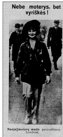
10 pav. Modernaus stiliaus moteris (NŽ 1926, 7)