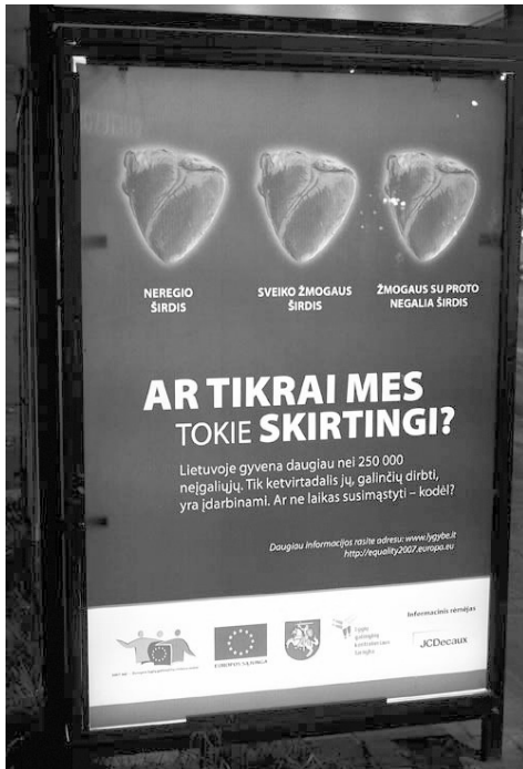
7 pav. Europos lygių galimybių metams skirta reklama

Buvo net keli labai panašūs lauko stendai, skirti kelti tolerancijos trūkumo visuomenėje klausimą. Logos argumentas čia vyrauja todėl, kad pati reklamos kompozicija primena mokslinį bandymą, kurio tikslas – atsakyti į klausimą, labai ryškiai pateiktą čia pat tamsiame reklamos paveiksle: „Ar tikrai mes tokie skirtingi?“. Atsakymą reikia surasti apžiūrėjus ir įvertinus trijų žmonių (mūsų nagrinėjamame pavyzdyje tai neregio, sveiko žmogaus ir žmogaus su proto negalia) širdis. Širdys pavaizduotos tikroviškai, tikrai lyg tiriamos žmogaus anatomiją išmanančio mokslininko, tačiau kiekvienam akivaizdu, kad jos vienodos.