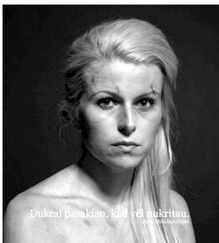
1 pav. Parodos „Moterys prieš smurtą“ nuotrauka (Rūta Mikelkevičiūtė)

Argumentų pasirinkimo atžvilgiu atrodo, kad buvo ketinta eiti ethos argumentavimo keliu: adresantas pasirinko jau pažįstamus veidus, tačiau emociškai sukretė pats grimas, kuris pakeitė šias moteris beveik neatpažįstamai. Taigi galima sakyti, kad pirmiausia veikė argumentai, apeliuojantys į jausmus, t. y. pathos argumentai. Logos sričiai galima būtų priskirti verbalinę reklamų dalį, kuria lyg ir bandoma atskleisti tokių įvykių „logiką“: kaip atsitinka, kad tarp artimų žmonių „nusistovi“ tokie santykiai. Tekstai visose nuotraukose – skirtingi, dalis jų lyg tų moterų ištarti žodžiai, žodžiai iš kasdienio jų dialogo su aplinkiniais, nusakantys situaciją ar bandantys paaiškinti smurto mechanizmą, kiti – apibendrintos frazės, frazeologizmai, nešantys užkoduotą reikšminį krūvį, kartais suskambantys net ironiškai („Mano vyras stiprus žmogus“; „Meilė žudo“; „Kol mirtis mus išskirs“). Visos nuotraukos pasiekia tikslą: nutiekia neigiamai egzistuojančios problemos atžvilgiu, verčia ją pastebėti ir priešintis. Įtikinamesnės atrodo tos, kurios „cituoja“