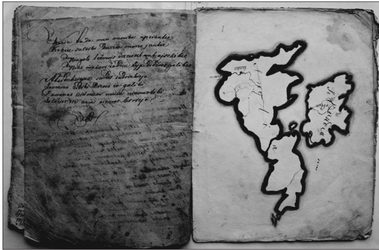
Eilėraščio „Saula tekis“ pabaiga bei Britų salų žemėlapis

Užupiečius (ji aktualizuojama Antano Baranausko eilėraščiu „Saula tekis“ 48 ).