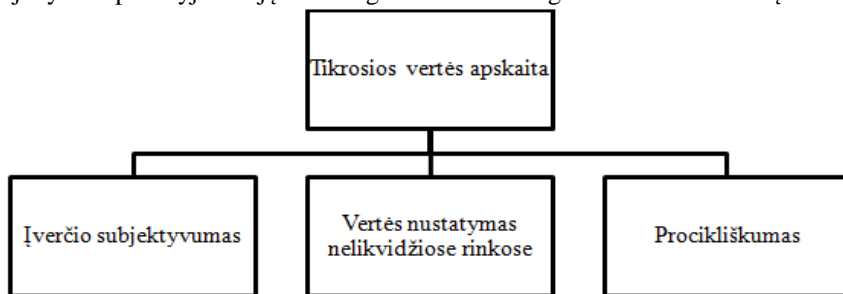
1 pav. Pagrindiniai tikrosios vertės vertinimo kriterijai

Siekiant išsiaiškinti tikrosios vertės ir krizės ryšį, 1 pav. pateikti pagrindiniai tikrosios vertės šalininkų ir oponentų diskusijų objektai, siekiant patvirtinti arba paneigti tikrosios vertės vertinimo apskaitoje ir finansų krizės ryšį. Visi išskirti kriterijai yra tarpusavyje susiję ir tiesiogiai arba netiesiogiai veikia vienas kitą.