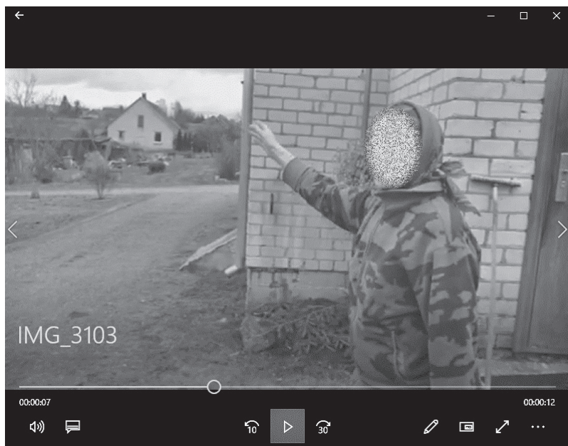
4 nuotrauka. Šitas kelias

(7) [ Šitas G1 kelias.] (žr. 4 nuotrauką).