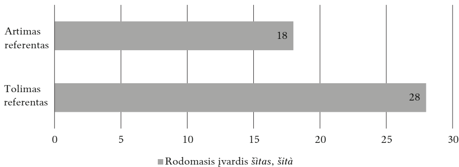
1 diagrama. Rodomojo įvardžio šitas, šità pasiskirstymas identifikuojant subjektą / objektą

Kaip minėta, iš viso tyrimui atrinkti 46 pasakymai su rodomuoju įvardžiu šitas, šità . Analizuojamieji kontekstai parodė, kad bendrojo suvokimo lauke kalbėtojas referentą suvokia kaip itin atpažįstamą, kai mano, kad pašnekovas lengvai jį atpažins. Remiantis straipsnio įvade apibrėžta atstumo sąvoka, referentai pasiskirstė taip (žr. 1 diagramą):