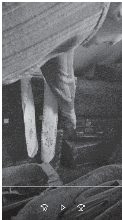
3 nuotrauka. G1 naudojimas identifikuojant referentą

(5) [ Mes čia prie šitųG2 jazminų nusipaveikslavome ];