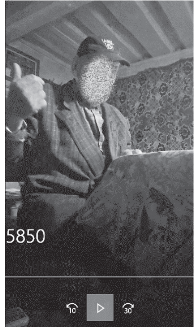
7 nuotrauka. Rodoma į nematomą kaimyno namą

Gundel et al. (1978) referento atpažįstamumui tirti pritaikė tam tikrą kognityvinių sąlygų skalę (ang. a scale of discrete cognitive statuses ): dėmesio sutelkimas, suaktyvinimas, pažįstamumas, vienareikšmiška identifikacija, re-