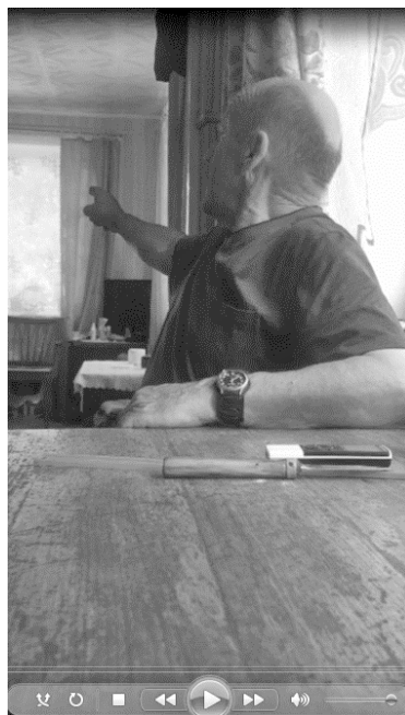
2 nuotrauka. Kalbėtojo vieta uždarose erdvėse. Adresatas laiko vaizdo kamerą

* Nuotrauka iliustruoja kalbėtojo ir klausytojo padėtį atviroje erdvėje, jei netaikomas amžiaus kriterijus. Stengtasi surasti aiškiausią ir geriausiai reprezentuojančią iliustraciją.