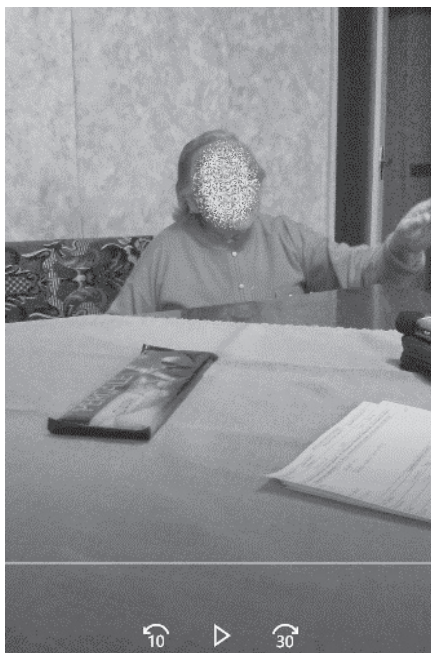
6 nuotrauka. Rodoma į tolimesnę kaimyno namą

(13) ir (14) pavyzdžiuose taip pat identifikuojami tolimi (maždaug už vieno kilometro ar toliau), tik kalbėtojui matomi objektai. Abiem atvejais rodoma (G1) į konkretų per langą matomą namą. Objektai yra vieninteliai kalbėtojų dėmesio centre: (13) kaimo pakraštyje esantis kampinis namas; (14) sodyba ant kalno laukuose, kurią nuo pokalbio vietos skiria kelias. Pasakymams bendra ir tai, kad juose vietoje žodžio namas vartojamas žodis kaimynas , t. y. kaimynas sutapatinamas su gyvenamąja vieta. Adresatas šiose situacijose apskritai neturi vizualinės prieigos prie referento, tačiau, kaip matyti iš nuotraukos, jis mato kalbėtojo kūno kalbą: padėtį, žvilgsnį ir deiktinį gestą – rodydamą ranka. Dėl išsiskiriančių referento savybių – matomas ir vienintelis tokios rūšies objektas – kalbėtojas jį suvokia kaip lengvai atpažįstamą. Žodis kaimynas taip pat turi semantinį svorį – adresantas yra pažįstamoje aplinkoje, kalba apie pažįstamus žmones. Tai gali turėti įtakos jo pasirinkimui. Tai-