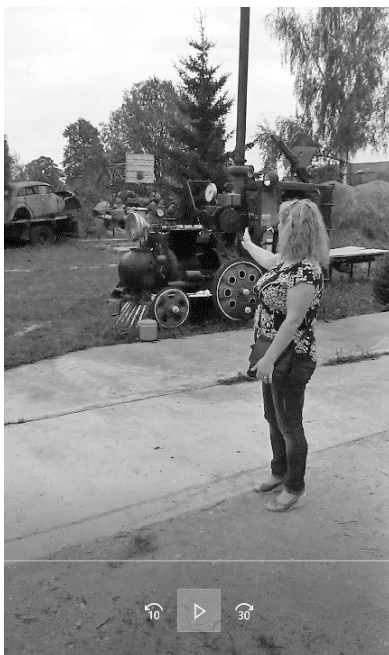
1 nuotrauka. Kalbėtojo vieta atvirose erdvėse. Adresatas laiko vaizdo kamerą*