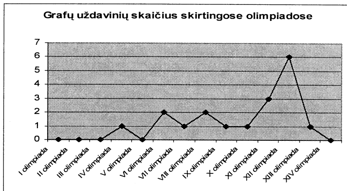
2 pav. Grafų uždavinių pasiskirstymas olimpiadose.

Skaičių teorijos uždaviniams spręsti dažniausiai reikėjo taikyti mokyklinės matematikos metodus ar remtis skaičių savybėmis: skaidyti dauginamaisiais natūraliojo skaičiaus faktorialą (skaidomas ne jis pats, o jį sudarantys dauginamieji), remtis Eroto-steno rėčio metodu, ieškoti skaičiaus daliklių, ieškoti mažiausiojo bendro kartotinio ir