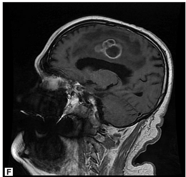
1 pav. Galvos MRT (2016-05-04)