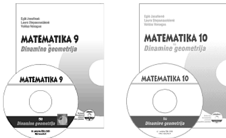
1 pav. „Dinaminės geometrijos“ priemonių kompleksas 9–10 klasių matematikos kursui

Matematikos tyrinėjimas – vienas esminių konstruktyvistine pedagogika pagrįstų mokymosi būdų. Daug dėmesio ir priemonių matematikos pradžiai tyrinėti skiria Logo pedagogikos šalininkai (Papert, 1995). Kaip įsitikinome, „Dinaminė geometrija“ tam irgi gerai tinka (Stepanauskienė, 2001). „Dinaminės geometrijos“ brėžinių sukurtas kompleksas gali tapti puikia priemone įvairioms matematikos temoms tyrinėti – šitaip stiprinamas konstruktyvistinis mokymosi būdas.