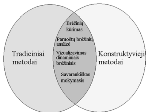
1 pav. Mokymo(si) metodų derinimas.