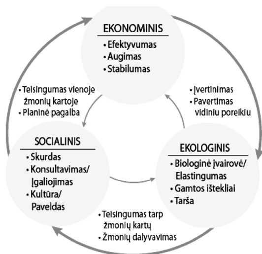
1 pav. Darnaus vystymosi koncepcija

Aplinka aprūpina visuomenę gyvybiniais ištekliais (oru, vandeniu ir t. t.), ku-