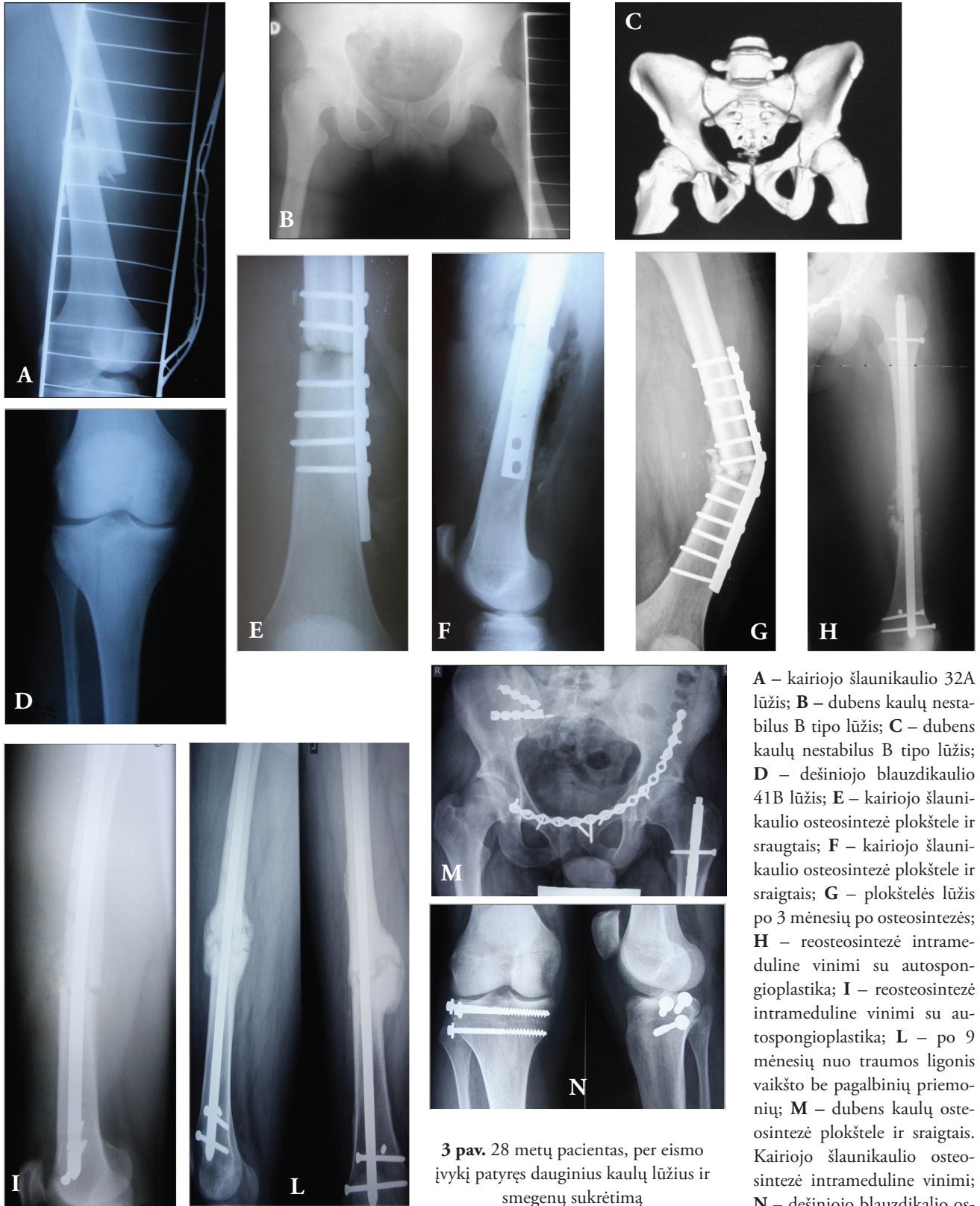
A – kairiojo šlaunikaulio 32A lūžis; B – dubens kaulų nestabilus B tipo lūžis; C – dubens kaulų nestabilus B tipo lūžis; D – dešiniojo blauzdikaulio 41B lūžis; E – kairiojo šlaunikaulio osteosintezė plokšte ir sraigtais; F – kairiojo šlaunikaulio osteosintezė plokšte ir sraigtais; G – plokštelės lūžis po 3 mėnesių po osteosintezės; H – reosteosintezė intrameduline vinimi su autospongioplastika; I – reosteosintezė intrameduline vinimi su autospongioplastika; L – po 9 mėnesių nuo traumos ligonis vaikšto be pagalbinių priemonių; M – dubens kaulų osteosintezė plokšte ir sraigtais. Kairiojo šlaunikaulio osteosintezė intrameduline vinimi; N – dešiniojo blauzdikaulio osteosintezė sraigtais