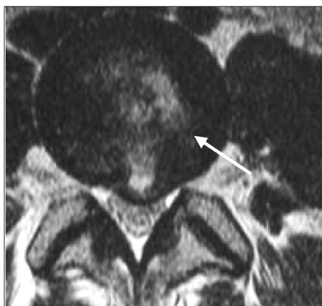
4 pav. Pooperacinis MRT vaizdas (2 mėn. po operacijos) matomas lazerio destrukcijos židinys (strėlė), nėra sekvestracijos ar uždegimo požymių

Geras, ilgai trunkantis efektas buvo 14 pacientų (70 %), dviem pacientams (10 %) negauta efekto, vienam pacientui (5 %) buvo trumpalaikis efektas (truko 6 mėn.), vėliau simptomai atsinaujino, pacientas operuotas pakartotinai. Trys pacientai (15 %) jautė pagerėjimą, bet