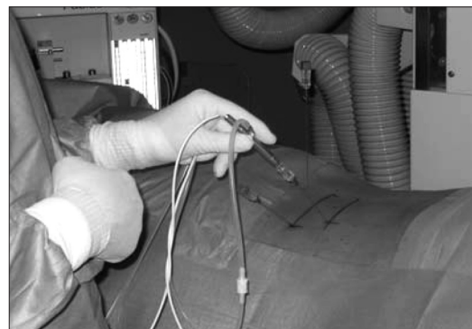
3 pav. Vyksta PLDD operacija