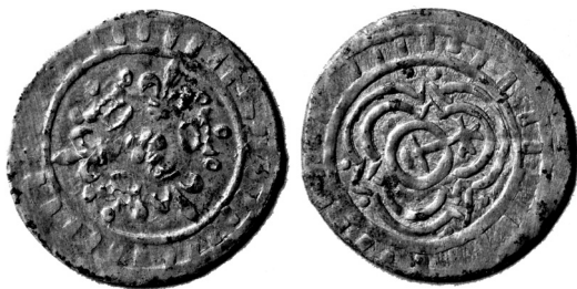
Skaičiavimo žetonas aversas ir reversas

Vienas pirmųjų šios in folio formato knygos savininkų nėra žinomas, tačiau, spėjama, gyvenęs XVI amžiuje. Priešlapyje jis paliko tekstą lotynų kalba bei gausias pastabas, komentarus veikalo paraštėse bei pačiame jo tekste. Inkunabulas įrištas XVI amžiuje – tai atskleidžia šiam laikotarpiui būdingi viršelio