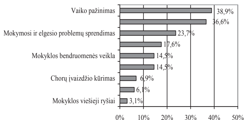
3 pav. Tėvų galimybės dalyvauti bendradarbiaujant su mokykla (N = 131)

Labiausiai tėvai linkę bendradarbiauti su mokytojais, siekdami labiau pažinti vaiką (38,9 proc.), bet, sprendžiant vaikų mokymosi ir elgesio problemas, tėvai sutinka pagelbėti tik iš dalies (žr. 3 pav.).