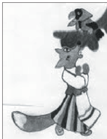
3 pav. J. Janišauskaitė, Gimtasis žodis 4 klasei (p. 49) ir E. Prėskienienė, Gimtasis žodis 3 klasei (p. 102) pasakėčių iliustracijų palyginimas

IV klasės vadovėlio iliustracija realistiškesnė; III klasės – alegoriška, todėl personažai dailininkės V. Voverienės „aprengti“ kaip žmonės. (Būtina priminti, kad dailininkai neretai parengia tekstui po kelias iliustracijas, kurias iš anksto ir vėliau derina su knygos / vadovėlio autoriumi.) Taigi toji „apdranga“ leidžia suvokti, jog žmonių būdo bruožai, žmonių tarpusavio santykiai ir poelgiai labai įvairūs, tad nevalia žioplinti gyvenime, keltis į puikybę.