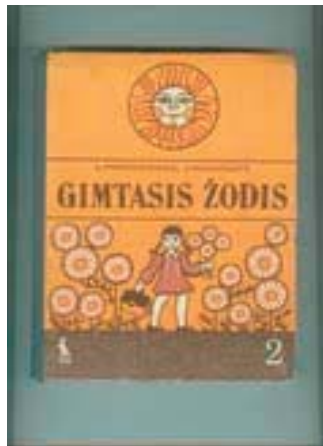
Buvęs pavadinimas – „Ažuolėlis. Skaitiniai 2 klasei“. (1974–1978) Paskutinis leidimas 1983 m. Iliustravo L. Barisaitis ir N. Barisienė