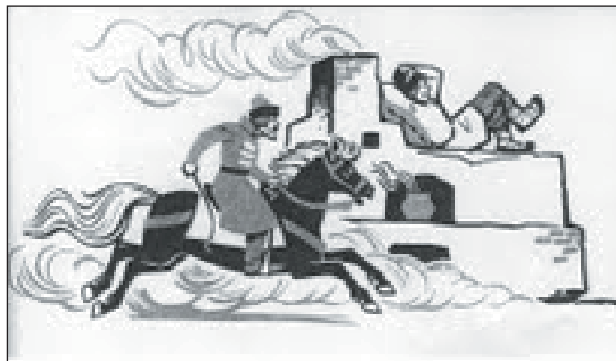
2 pav. Iliustracijų, demonstruojančių agresiją, pavyzdys

Antro, trečio, ketvirto skyrių – „Liaudis kovoja už laisvę“, „Didysis Tėvynės karas“, „Gyvent ir kurt pakilo mūsų kraštas“ – idėjinis kryptingumas sietinas su socialistinio patriotizmo ugdymu (iš viso 45 tekstai, arba 55 proc. visų skaitinių). Net pasakų iliustracijos (J. Janišauskaitės vadovėlis) demonstruoja agresiją. Taip šiurpiaus verbaliniais ir vizualiniais vaizdais buvo diegiama pagarba komunistų partijai ir meilė didžiajai sovietų šaliai (2 pav.).