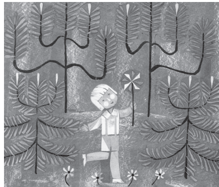
Šilų berniukas. Iliustravo Bronius Leonavičius

Akys, plaukai, pečiai, kojos – viskas „sulipdyta“ iš gamtinės miško medžiagos, o girios namuose Šilų berniukui eglės atstoja stogą, ežerėliai – langus, pieva – stalą, kupstai – kėdutes... Taip ir neišaiškėja, kas tie „jie“ migdė Šilų berniuką, kas mama – juk eglės šaka tik primena mamytės ranką. Tekstai, kuriuose yra išlaikoma paslaptis – patys paveikliausi. Neįmenama poetinė mįslė (o tokia šiuo atveju ji ir yra) prikausto skaitytoją, kviečia mąstyti, išsižiūrėti.