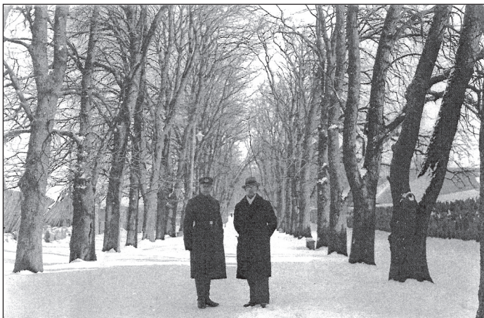
Kaštonų alėja Šiauliuose 1932 m. kovo mėnesį.

1939 m. šaltą žiemą Kaštonų alėjos senieji medžiai iššalo ir nudžiūvo. 1940 m. jie visi buvo iškirsti.