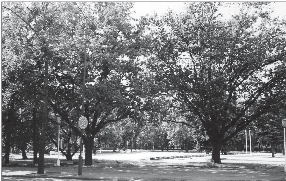
Spaudos medžiai – du ąžuolai Tilžės gatvėje, Šiauliuose, 2004 m.