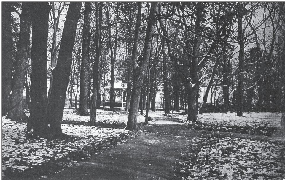
Šiaulių senasis parkas žiemą, apie 1960 m.