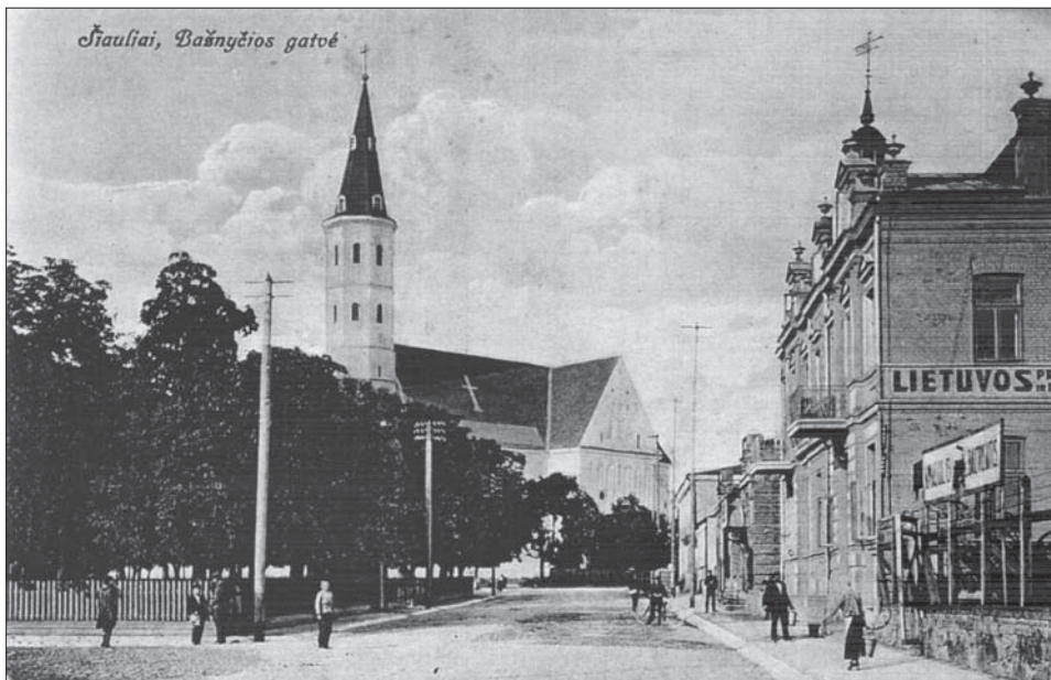
Šiame pastate (dešinėje) Bažnyčios g. 1 (dab. Vasario 16-osios g.), rūsijoje, nuo 1923 m. rugsėjo 1 d. veikė „Titnago“ spaustuvė. K. Cerpinskio išleistas atvirukas.

„Titnago“ spaustuvė įsikūrusi Vasario 16-osios g. 52. Dabar joje veikia kompiuterių įranga, dvi rotacinės ofsetinės spaudos mašinos („Zirkon-66“ ir „RO-62“), laikraščių spausdinimo mašina „Newslite 30“, dvi plokščiosios mašinos „Dominant“, tripeilė bei 3 vienpeilės pjovimo mašinos, iškirtimo presas, knygų įrišimo linija, pakavimo automatai ir kt. įrenginiai. Spaustuvėje esančios rotacinės spaudos