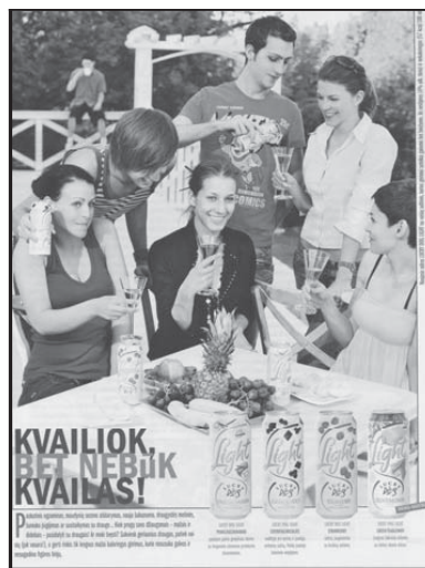
5 pav. „Lucky dog light“ reklama („Panelė“, 2008, nr. 6)

Lietuvos žurnaluose reklama nėra atidžiai cenzuruojama pagal amžių – pagal galiojančius Lietuvos teisės aktus ne visada įmanoma įvertinti, ar reklama pažeidžia įstatymus.