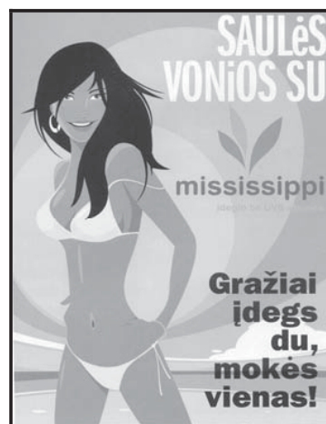
6 pav. „Mississippi“ reklama („Panelė“, 2009, nr. 6)