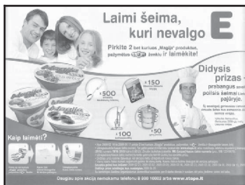
9 pav. „Magija“ reklama („Panelė“, 2009, nr. 3)

„Tai yra kažkas, ką visa šeima gali padaryti kartu!“ ar „Tai yra kažkas, ką mama nupirks ir bus patenkinta, kad nupirko tau“ – panašiai kalbama ir indų ploviklio, ir šokolado reklamose. Paaugliams skirtuose žurnaluose tokių reklamų nedaug, dažniausiai jos skelbiamos televizijoje – reklamos adresantai taisyklingai ne tik į vaiką, bet ir į visą šeimą (9 pav.). Šeimai skirti pranešimai Lietuvoje dažniausiai reklamuoja užkandines, picerijas, prekybos centrus. Šeimos darumas žavi, nes realiame gyvenime paaugliai dažnai būna nesuprasti tėvų ar kitų šeimos narių.