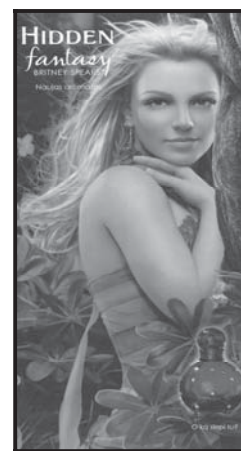
8 pav. „Hidden fantasy“ reklama („Panelė“, 2009, nr. 3)