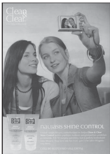
4 pav. „Clean & Clear“ reklama („Justė“, 2008, nr. 10)

Dažnai reklamų modeliai tampa sektiniais pavyzdžiais – jie dažnai yra vyresni ir žavesni už tikslinės auditorijos narius (žr. 4, 5 pav.). Blizgučiai, ryškios etiketės, diskotekinis ritmas ir kieto jaunuolio atvaizdas šaukte šaukia būti tokiam pačiam – būti madingam ir pripažintam bendraamžių. Reklamos įtaigios, todėl patikima išgalvotu idealiu pasauliu su trokštamais daiktais ir draugais.