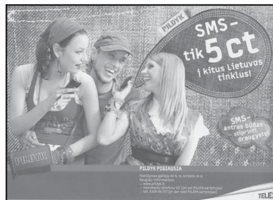
3 pav. „Pildyk“ reklama („Čili cukrus“, 2006, nr. 6)

Ne rūpestingą ir linksną gyvenimą nuolat siūlo jau ne pirmus metus televizijos ir spaudos reklamose šėliojantys „Pildyk“ personažai (3 pav.). Didžiąją dalį siūlomų paslaugų vartotojų sudaro jaunimas, todėl operatoriai yra linkę prie jų taikytis kaip prie aktualaus tikslinio segmento, pirmiausia dėl įvaizdžio (Kriščiukaiytė, 2008). 2008 m. gegužę „Pildyk“ vieną dieną buvo „išsinuomojęs“ jaunimo mėgstamą radijo stotį „ZipFm“ – stoties pavadinimas ir tinklapis buvo pakeisti į „PildykFM“ (Migonytė, 2008). Kryptingumas, vientisumas, netradicinių reklamos formų derinimas su daugelį metų patikrintomis strategijomis duoda rezultatų – šis prekės ženklas yra neatsiejama paauglių gyvenimo dalis.