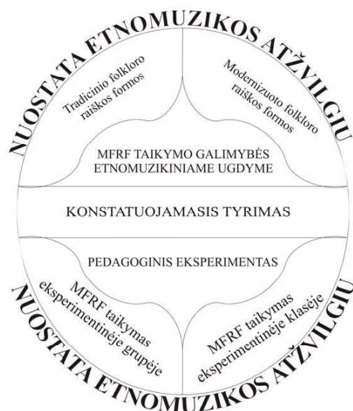
1 pav. Nuostatų etnomuzikos atžvilgiu ugdymas MFRF tyrimo dizainas

Šios eksperimentinės metodikos pagrindai buvo formuojami remiantis tyrėjo kelių metų praktinio pedagoginio darbo (pamokinės ir popamokinės veiklos 6 ) ir koncertinės veiklos patirtimi. Lietuvių liaudies muzikos populiarinimo modernizuoto folkloro raiškos formomis idėja pradėta realizuoti 2002 m. su Šiaulių universiteto studentų modernizuoto folkloro grupe. Nuo 2005 m. ši idėja išsirutuliojo į pedagoginę idėją Modernizuoto folkloro raiškos formų taikymas etnomuzikiniame ugdyme .