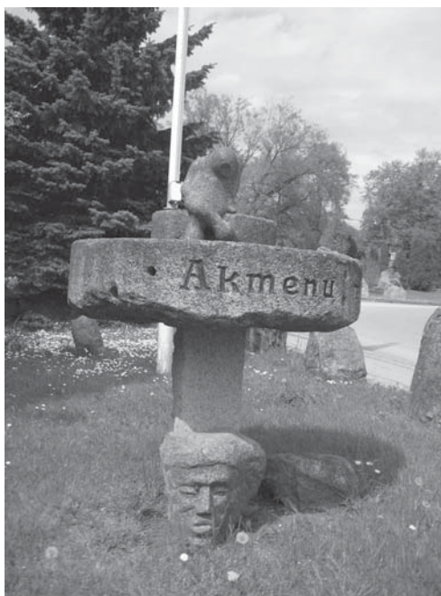
2 pav. Nuoroda į Akmenų muziejų Mosėdyje