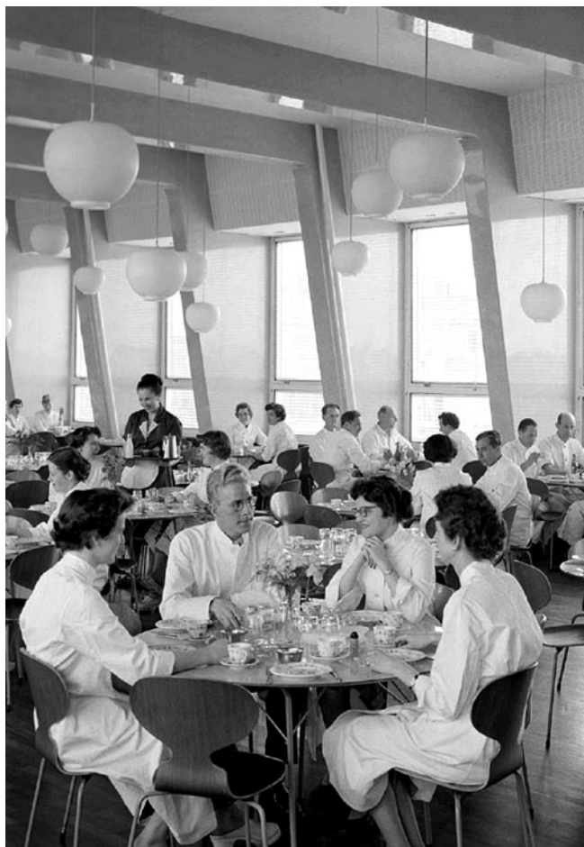
7 pav. „Novo“ fabriko valgykla, 1952 m. Specialiai valgyklai žymus Danijos dizaineris Arne Jakobsenas suprojektavo baldus, tarp jų ir garsiąją trikoję kėdę „Skrudė“.

Svajones apie fabriką arba apie industrializuotos visuomenės ateitį geriausiai įkūnija farmacijos įmonės „Novo“ šūkis „Viskas įmanoma!“, pranešantis moderniajai visuomenei, kad turint pakankamai žinių įmanoma nugalėti bet ką (šiuo atveju bet kokią ligą). Pramonės plėtra neatsiejama su mokslo išradimų, o naujosios įmonės Skandinavijoje išaugo ne tik kaip ekonominės, bet ir kaip socialinės institucijos, kurių