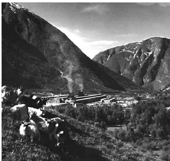
3 pav. Fabrikas ir miestas – neišskiriami: Norvegijos industrializacija, Årdalis, 1958 m.

Švedijos pokario vystymo svajones apie gerovės valstybės statybą įkūnija telekomunikacijų bendrovės „LM Ericsson“ plėtra 20 . Nuo pat 1930 m. buvo svajojama paversti Švediją nauja ir modernia šalimi. Įmonės, profesinės sąjungos, žmonės ir visuomenė