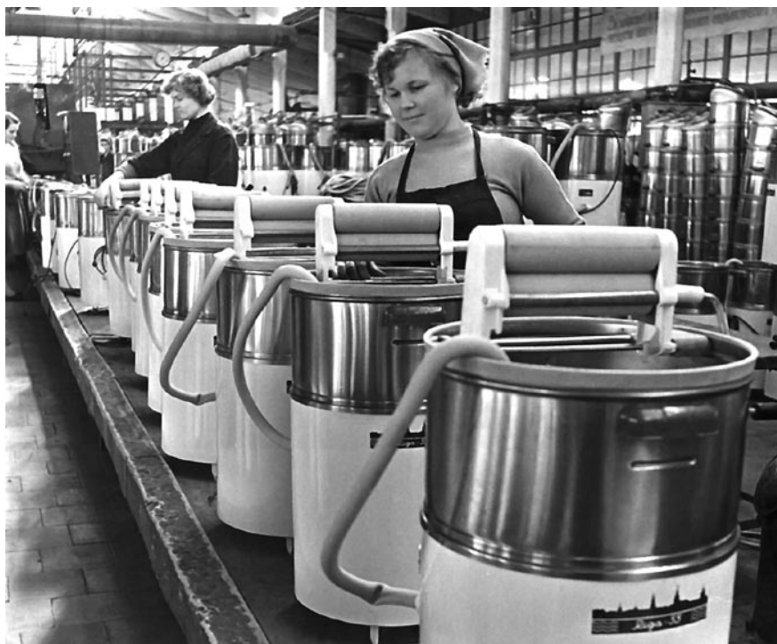
9 pav. Darbininkės mašinų ceche, Rygos elektros mašinų fabrike, 1961 m.

Didžiąją dalį kolektyvinio laisvalaikio ir kultūrinių renginių pokario Šiaurės ir Baltijos šalyse organizavo gamyklos ir jų profesinės sąjungos. Jų rūpesčiu buvo pastatytos sporto arenos, susirinkimų salės ir įsteigtos įvairios draugijos. Įmonės skatino