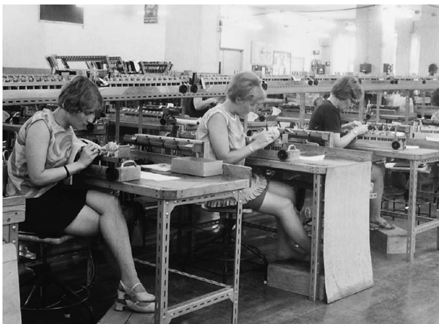
5 pav. Darbininkės „LM Ericsson“ fabrike, mažame Katrineholmo miestelyje, 1960 m.