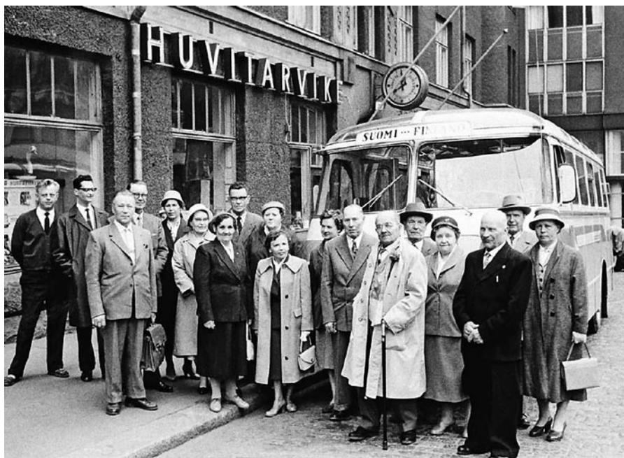
2 pav. „Elanto“ keliautojų klubas, išvyka į Leningradą, 1960 m.