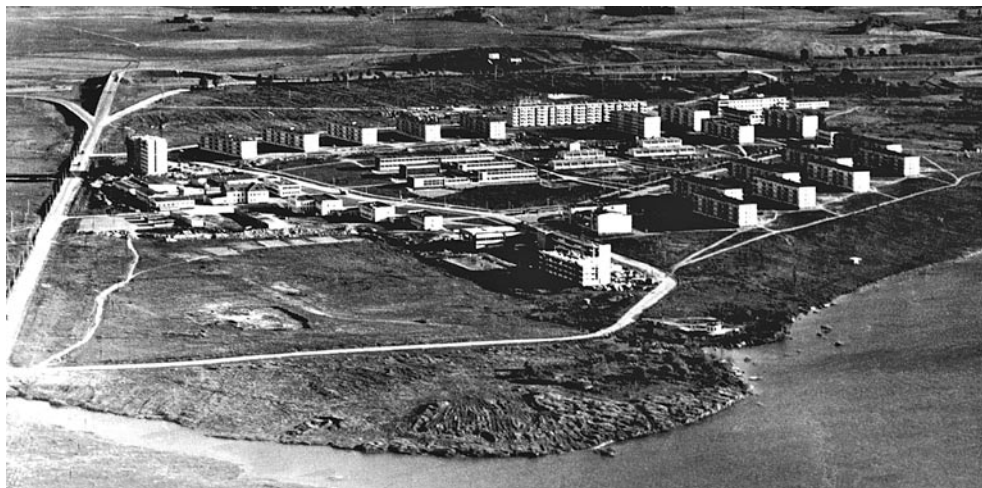
6 pav. Naujas modernus miestas Elektrėnai, 1964 m.

visuomenėje išaugo naujos specializuotos darbo jėgos poreikis: XX a. šeštąjį dešimtmetį laborantės dar buvo apmokomos darbo vietoje arba trijų mėnesių kursuose; šandien specializuotas jų parengimas trunka 2,5 metų.