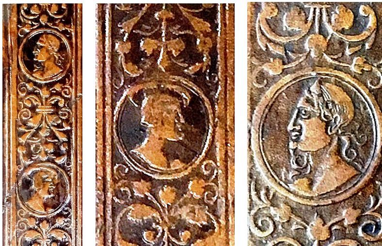
16 ILIUSTR. Ruletės išpaudai „Portretai“ (BAV 53.3.2; II 4714 2 )

šimais tarp jų, be jokio išpausto teksto. Su šios ruletės išpaudais VU bibliotekoje rastos 5 Žygimanto Augusto bibliotekos knygos, kurios buvo įrištos 1547 (sąrašo nr. 12), 1550 (sąrašo nr. 4), 1551 (sąrašo nr. 5), 1555 (sąrašo nr. 3), 1559 m. (sąrašo nr. 13). Po dvi iš jų pažymėtos superekslibrisais „Angeliukas“ (sąrašo nr. 3–4) ir „Suglausti skydai“ (sąrašo nr. 5, 12). Viena – superekslibrisu „MAGNVS DVX“ (sąrašo nr. 13). Atsižvelgiant į įrišimo metus (1559) bei panaudotą superekslibrisą („MAGNVS DVX“), galima daryti prielaidą, kad ruletė „Portretai“ buvo pervežta į Vilnių ir Vilniaus pirmojo knygrišio panaudota 1559 m., įrišant bent jau vieną Žygimanto Augusto bibliotekos knygą (sąrašo nr. 13).