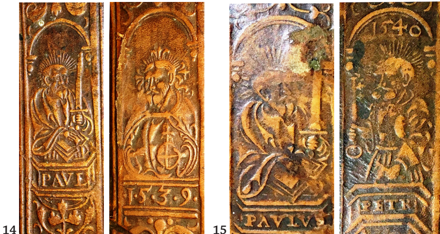
14 ILIISTR. Ruletės išpaudas „Petras ir Paulius 1539“ (II 4714 1/2 )

Kitas ruletės variantas „ Petras ir Paulius 1540 “ 51 (vieno siužeto aukštis 33 mm, plotis 14 mm; sąrašo nr. 2, 21) – labai panaši ruletė į anksčiau aptartąją su šventųjų Petro ir Pauliaus bei Jėzaus atvaizdais. Truputį skiriasi užrašytas tekstas po portretais: „PAVLVS“, „PETR“, „SALVATO“, data „1540“ yra išpaušta virš Petro galvos esančiame arkos išlenkime, o ne po Jėzaus atvaizdu, kaip 1539 m. ruletėje. 1540 m. rulete papuoštos Žygimanto Augusto bibliotekos knygos buvo įrištos Krokuvoje 1550 (sąrašo nr. 2) ir 1554 m. (sąrašo nr. 21) bei pažymėtos superekslibrisais „Angeliukas“ (sąrašo nr. 2) ir „Suglausti skydai“ (sąrašo nr. 21). Galima papildyti E. Laucevičiaus teiginį, jog šią ruletę naudojo Krokuvos knygrišys, įrišdamas Žygimanto Augusto knygą 1552 m. 52 Iš tikrųjų, ši ruletė knygrišio buvo naudojama bent jau 1550–1554 m. (žr. 1 lentelę).