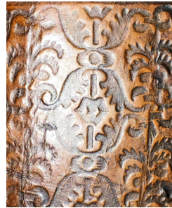
40 ILIISTR. Nugarėlė su išpaisais „IM“ (II 4703–4704)