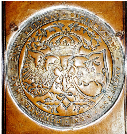
3 ILLUSTR. Superekslibrisas „MAG DVX“ (BAV 47.5.6)