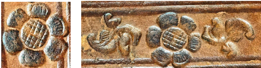
37 ILIUSTR. Pavienis įspaudas „Šešialapis“ ir kompozicija su „Lapeliais“ (II 1768 /1-4 )

„ Šešialapis “ 80 (Ø 12 mm; sąrašo nr. 17). Šiais šešių žiedlapių žiedais papuošta viena VU bibliotekoje esanti Žygimanto Augusto knyga, kuri buvo įrišta 1550 m. Krokuvos knygrišio. Šioje knygoje įspautas ir superekslibrisas „Angeliukas“. „Šešialapiai“ įspauti tuščiuose tarpuose tarp ruletės ir režtuko įspaudų, kartais komponuojant šį įspaudą iš vienos arba iš abiejų pusių su „Lapelio“ įspaudu, taip sukuriant visiškai naują ornamentą.