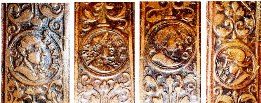
5 ILIUSTR. Ruletės įspaudai su tekstu: „PENEL // O“, „HELE // NA“, „HECTO // R“, „ENE // VS“ (II 1768 /1-4 )

„Antika“ 35 (portretų Ø 15 mm; sąrašo nr. 17) – ruletė su nedideliais antiikinų herojų portretais, aplink kuriuos matomi jų vardai: „ENEVS“, „HELENA“, „PENELO“, „HECTOR“. Virš portreto su vardu „ENEVS“ matoma įspausta ir data: „1542“. Portretai vienas nuo kito atskirti raitytais renesansiniais augaliniais ornamentais. Šios ruletės įspaudais papuošta viena Krokuvoje 1550 m. įrišta knyga su Žygimanto Augusto superekslibrisu „Angeliukas“.