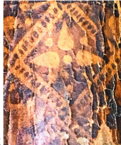
41 ILIISTR. Nugarėlė su išpaisais „Lapeliai rombuose“ (II 4706)