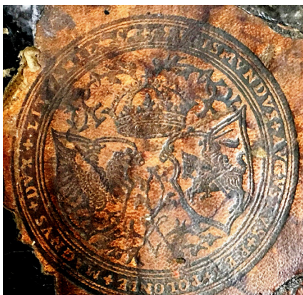
4 ILLUSTR. Superekslibrisas „MAGNVS DVX“ (II 4716)