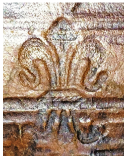
29 ILIISTR. Pavieniai įspaudai „Lelija 4“ (II 1768 /1-4 )

„Penkialapis“ 71 (Ø 10 mm; sąrašo nr. 11). Penkialapio žiedo įspaudas buvo rastas vienoje VU bibliotekos knygoje, pažymėtoje Žygimanto Augusto superekslibrisu „MAG DVX“ ir įrištoje Vilniuje antrojo knygrišio 1560 m. Juo papuošti viršutinio ir apatinio kietviršio superekslibriso veidrodžio kampai, viršus ir apačia. Šio įspaudo žiedo viduriukas yra raižytas, o žiedlapiai puošti vingiuotomis juostelėmis.