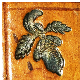
20 ILLUSTR. Pavieniai išpaudai „Gilė“ (II 4702 2 ir BAV 53.3.2)

„Kampinis“ 62 (spindulys 15 mm; sąrašo nr. 13, 19). Tai augalo su stiebu, lapais ir žiedynu ornamentas, apjuostas rantiu lanku. Šis viršutiniame kietviršyje superekslibriso veidrodžio kampuose esantis ornamentinis išpaudas rastas dviejose VU bibliotekoje esančiose Žygimanto Augusto knygose, pažymėtose superekslibrisu „MAGNVS DVX“, kurios buvo įrištos 1559 (sąrašo nr. 13) ir 1560 m. (sąrašo nr. 19) Vilniuje dirbusio pirmojo knygrišio.