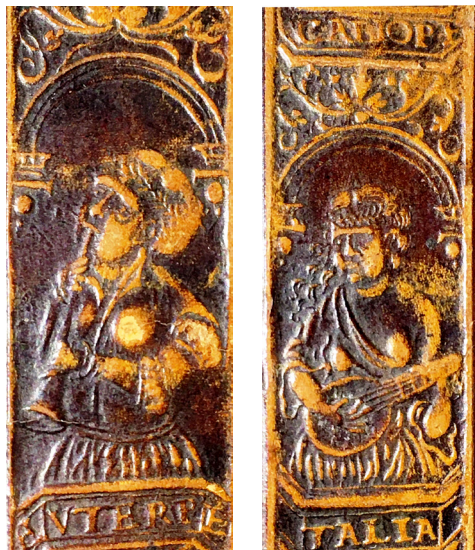
13 ILLUSTR. Ruletės įspaudai „Mūzos“ su tekstu „EVTERPE“, „TALIA“ (BAV 47.5.6)