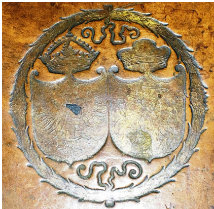
2 ILIUSTR. Supereklibrisas „Suglausti skydai“ (BAV 70.4.4)