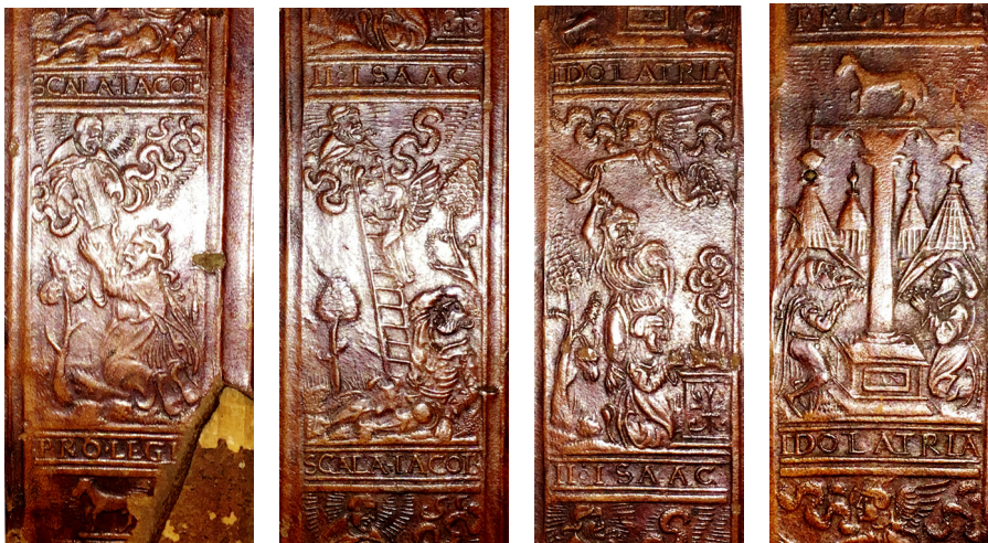
12 ILIISTR. Ruletės įspaudai „IDOLATRIA“ su tekstu „PRO LEGI...“, „SCALA IACOB“, „II ISAAC“, „IDOLATRIA“ (II 4703–4704)