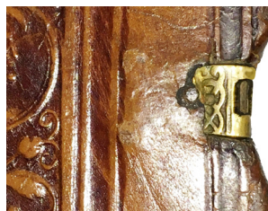
47 ILIUSTR. Segtuvai „Tik kilpelės“ ir po oda buvusi paslėpta, bet nutrupėjęs odai atsivėrusi tvirtinimo plokštelė (BAV 53.3.2)