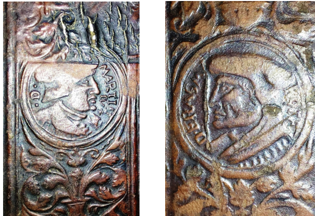
17 ILIUSTR. Ruletės įspaudai „Reformatai“ su tekstu „D. // MARTIN // LVT“, D. ERASM // ROT“ (II 4706)

PAVIENIAI ĮSPAUDAI. Vilniaus universiteto bibliotekoje esančiose Žygimanto Augusto bibliotekos knygose iš viso užfiksuotas 21 skirtingas pavienis ornamentinis įspaudas 56 .