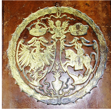
1 ILIUSTR. Superekslibrisas „Angeliukas“ (II 1768 1-4 )