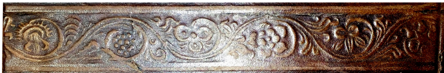
6 ILIUSTR. Ruletės įspaudas „Augalai“ (II 1768 1-4 )

Augusto rinkinio knygoje (įrišta 1550 m. Krokuvoje) panaudota ne visa. Ne visu šios ruletės įspaudu papuoštos tik virš ir po superekslibrisu „Angeliukas“ esančios tuščios vietos. Trūksta didžiosios dalies ruletės piešinio, todėl ją labai sunku palyginti su kitų tyrinėtojų veikaluose pateiktais rulečių įspaudais.