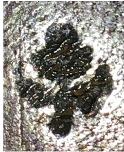
18 ILIUSTR. Pavienis įspaudas „Gėlė“ (II 4701)