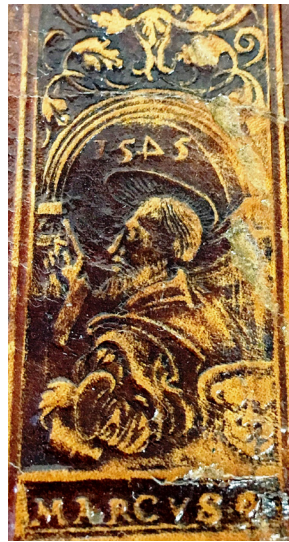
9 ILIUSTR. Ruletės įspaudas „Evangelistai“ (II 1789)