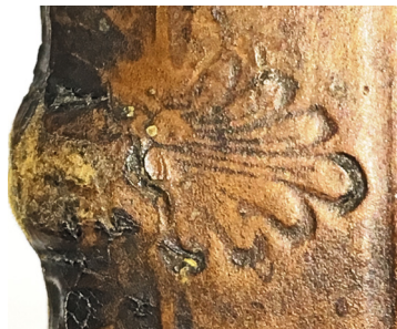
34 ILIUSTR. Pavienis įspaudas „7 lapeliai“ (II 4701)