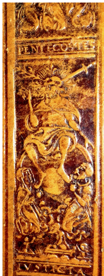
11 ILIISTR. Ruletės įspaudas „IVSTICIA“ (BAV 53.3.2)