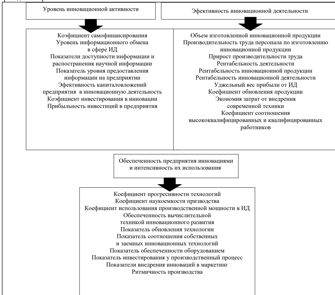
Рис. 1. Показатели расчета определенных параметров общего уровня инновационной деятельности на промышленном предприятии

Эффективность инновационной деятельности предусматривает определение способности предприятия к производству инновационной продукции и характеризуется анализом темпов производства новой продукции, определением целесообразности производства той или другой продукции, необходимостью направления средств в инновационное развитие, эффективности работы маркетинга по сбыту определенного типа и вида продукции, размеров дохода от результатов инновационной деятельности (ИД) и выручки от реализации инновационного типа продукции, суммы расходов на проведение ИД. За приведенной группой существуют возможности относительно оценки уровня поддержки государством инновационной деятельности предприятий и основные показатели приведены на рис. 1.