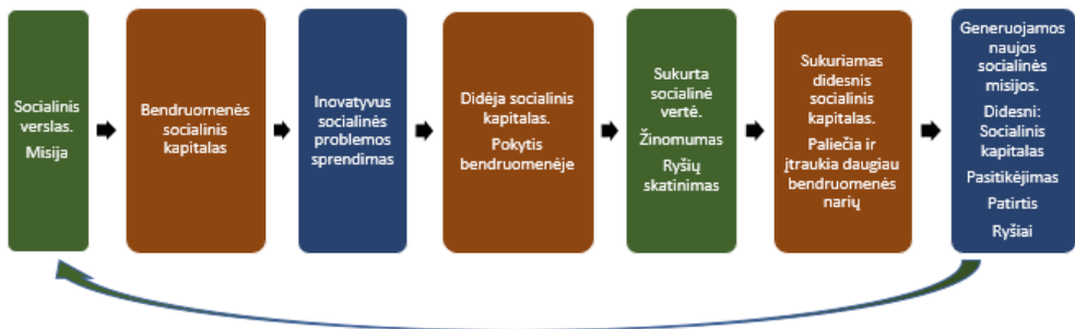
1 pav. Socialinio verslo ir socialinio kapitalo sąveikos grandinė